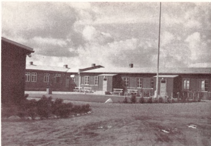
Jaruplund Højskole, set fra Gaarden.