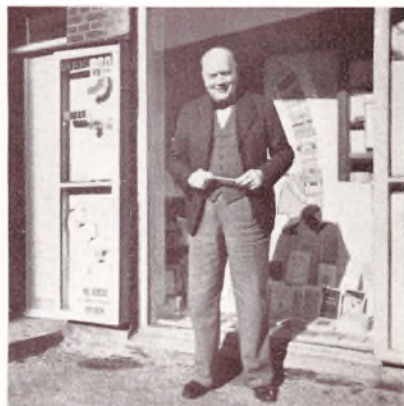
Alle Askovitters Boghandler.