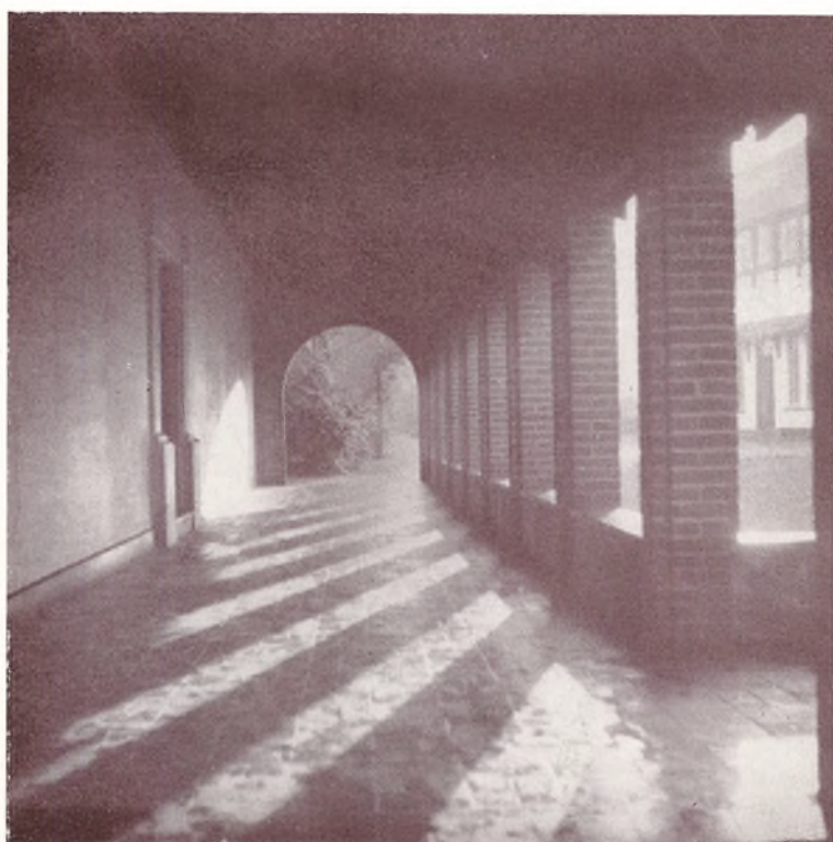
Buegangen. Vinter, Sommer — hver sit.