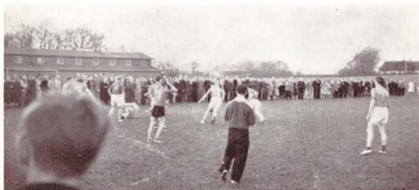
Et Hjørne af Fodbold-Tourneringen paa Ladelund Marts 1950.