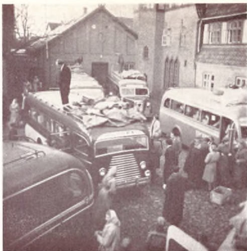
Forberedelserne til Paasketuren.