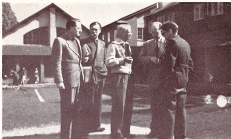
Et tilfældigt Møde.