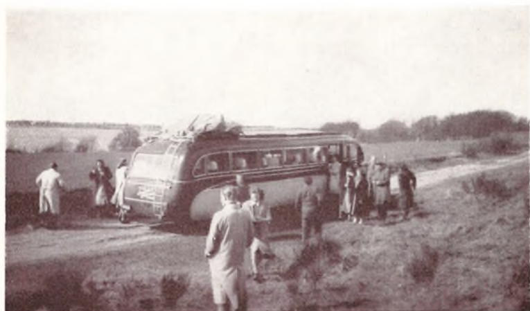
Rast under Kursisternes Sydslesvigtur.