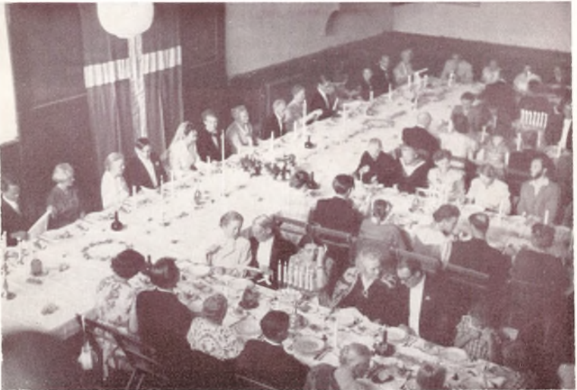
En Del af Dagmarsalen i Festskrud.