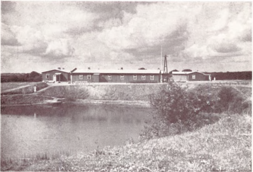
Højskolen set fra Haven, som skal plantes rundt om en ret stor Sø, fremkommen ved Udgravning af Mergel.