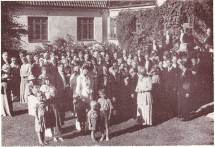
Efter Vielsen den 30. Juli.