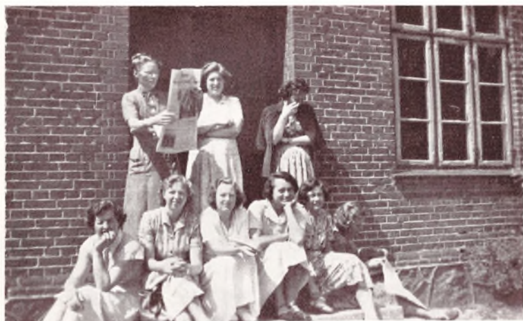
En tilfældig Flok.