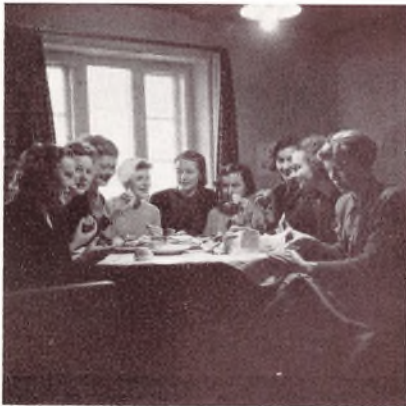
En Hyggestund paa Lindegaarden