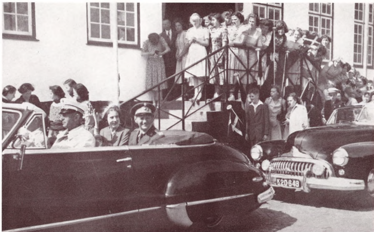
Kongen og Dronningen kører til Udstillingen efter »Sommerpigerne« Modtagelse.