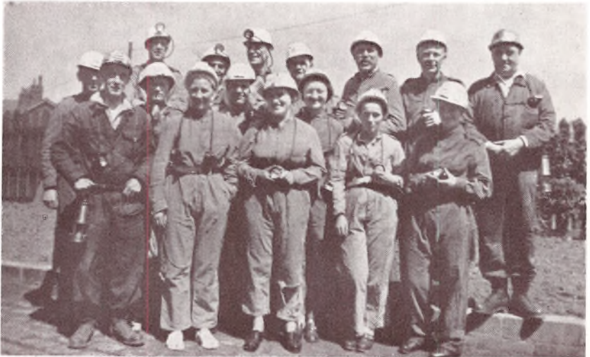
Flokken parat til Nedstigning i Kulgruberne udenfor Manchester.