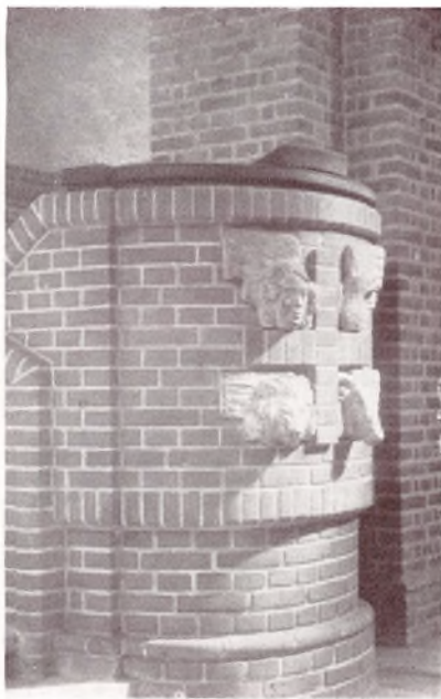
Prædikestolen i Solskin.