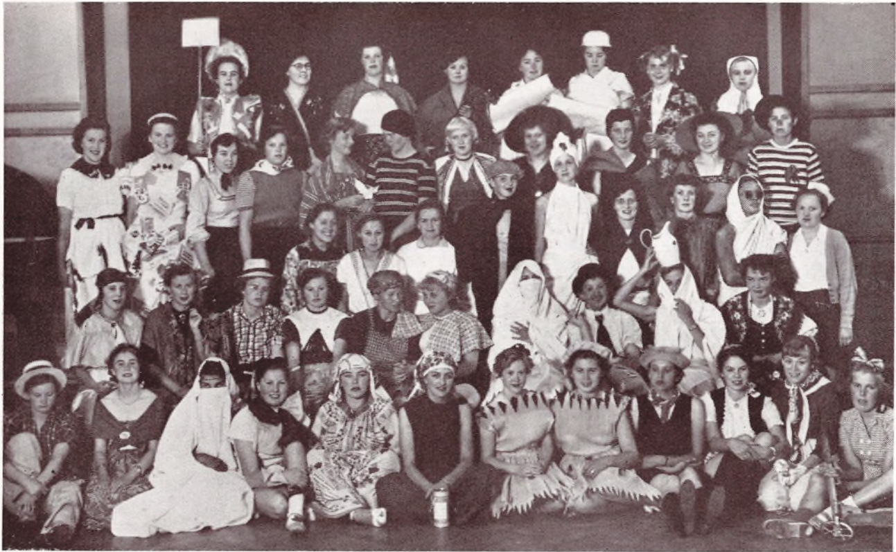
Sommerpigernes hjemmelavede Dragter til de mange morsomme Optrin, de viste os den 15. Juli.