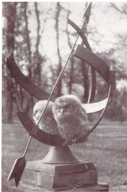
Skolens Yndlinge i Sommer.