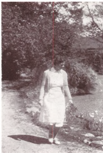
Hylling plukker Blomster.