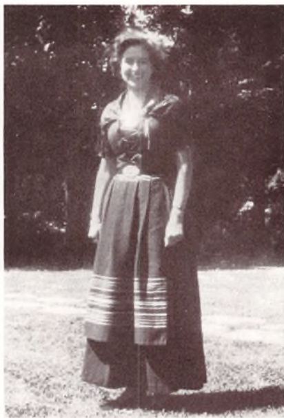
Vor Færo-Pige i sin Fæstdragt.