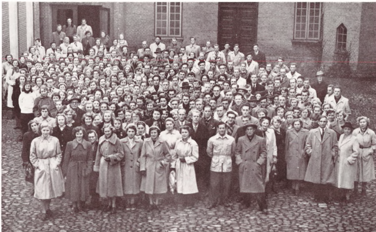
Vinterholdet færdigt til Skibelundtur den 9. Nov. 1951.