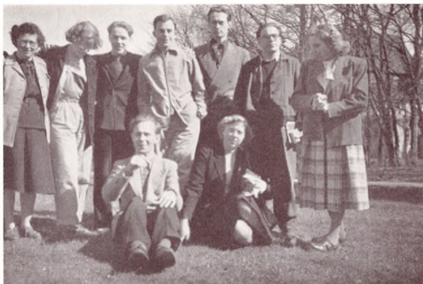
En Gruppe af Vinter-Eleverne i Foraaret 1951.