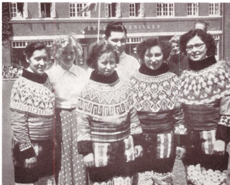
Vore fire søde Grønlandere paa Vejen Stationsplads, hvor de i Spidsen for Sommerpigerne modtog Kongeparret.