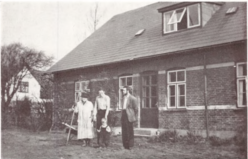
Ogsaa Haven skal forbedres.