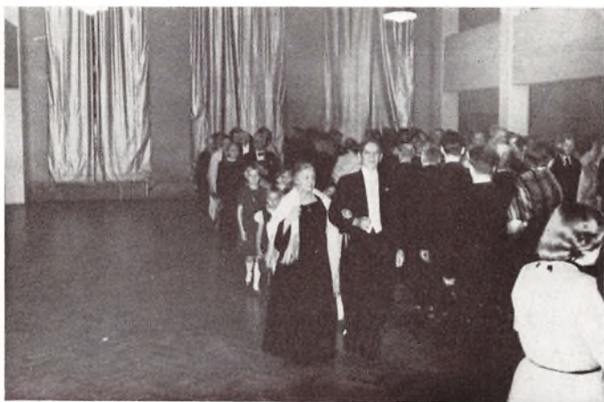
Indmarchen den 19. December 1952.