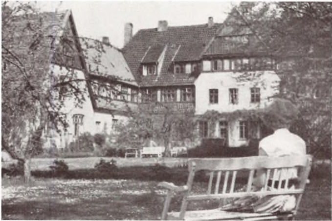
Ida nyder Middagsstunden.