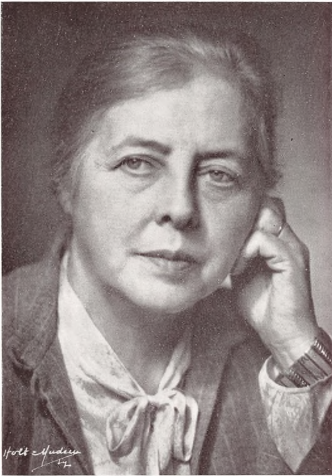
Efter de 25 Aar.