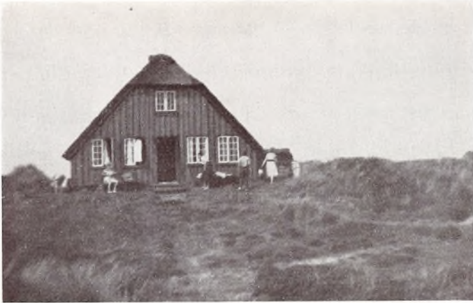
»Lyngbankerne« i Blaavand.