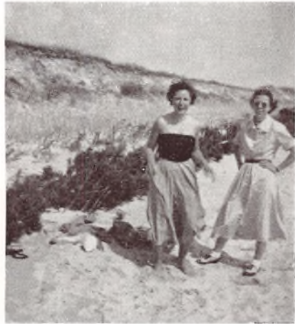
To paa Stranden.