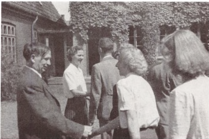
Modtagelse ved et-Sommer-Elevmøde.