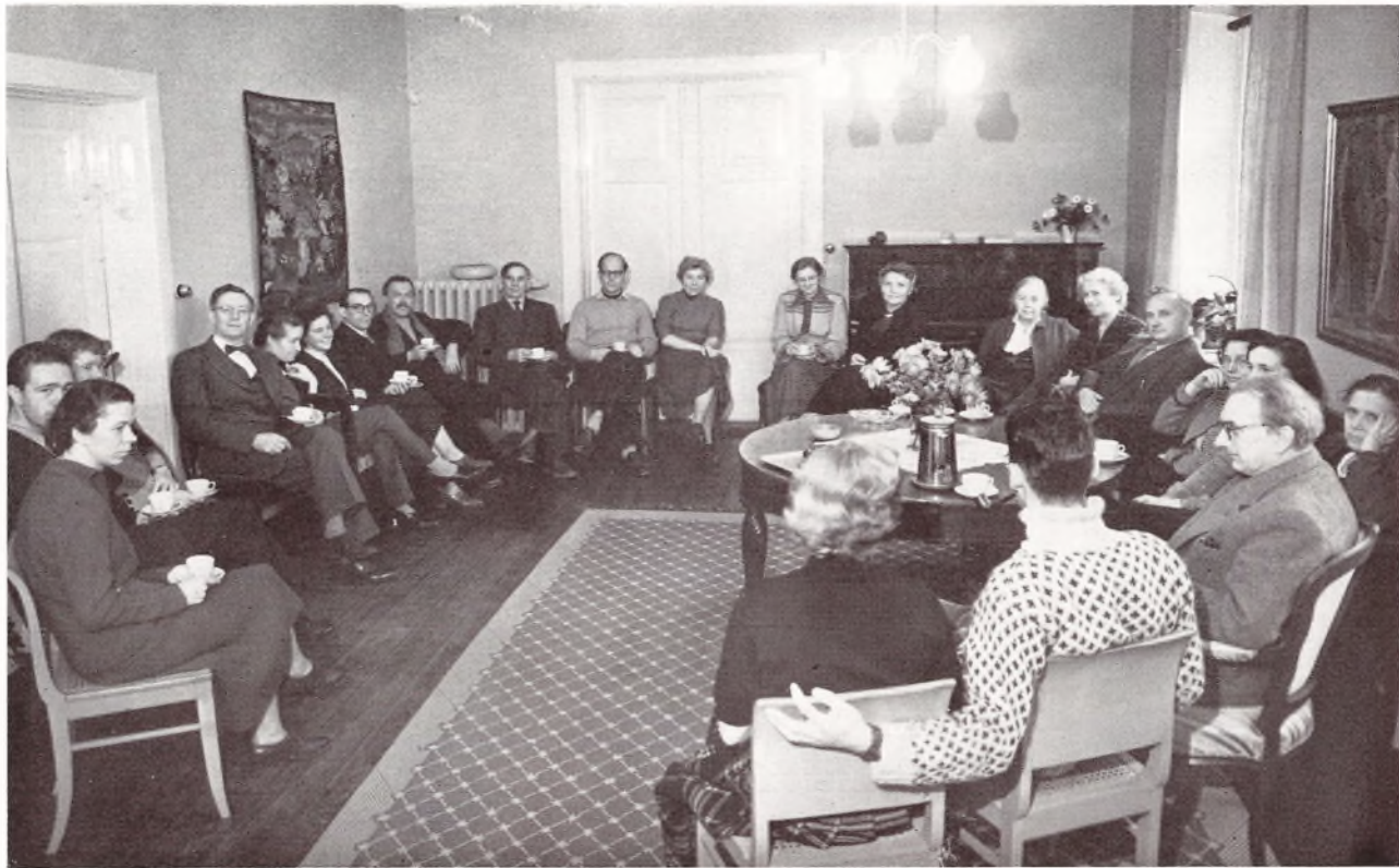
Dagligstuen i sin nye Skikkelse.