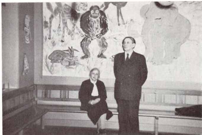
Fra Afskedsfesten paa Lindegaarden.