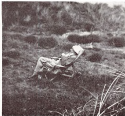
En salig Stund.