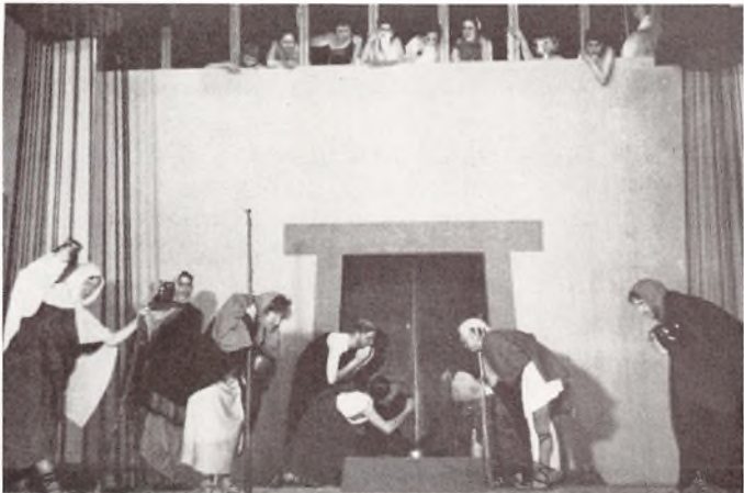
Mændene beder om Naade.