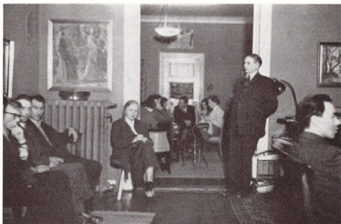
Sidste Hjemmeaften Vinteren 52—53.