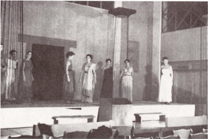
Fra Opførelsen af Aristophanes' »Lysistrate« Foraaret 53.