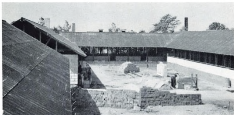
Det meste af en gruppe.