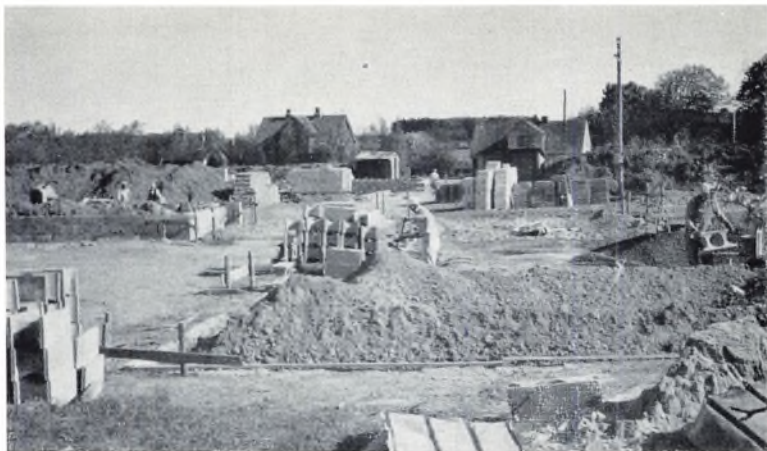
Grunden graves ud.