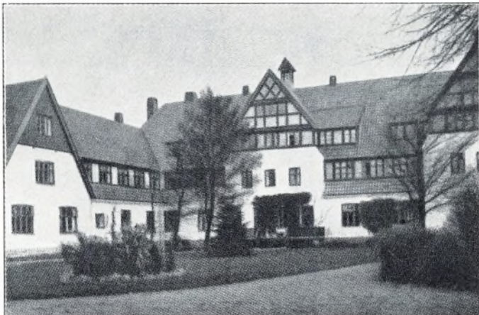
Højskolen efter ombygning 1913.