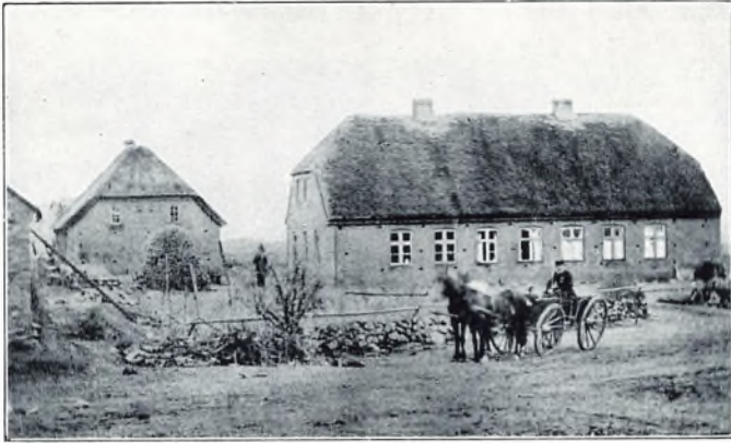
Fengers hus 1865.