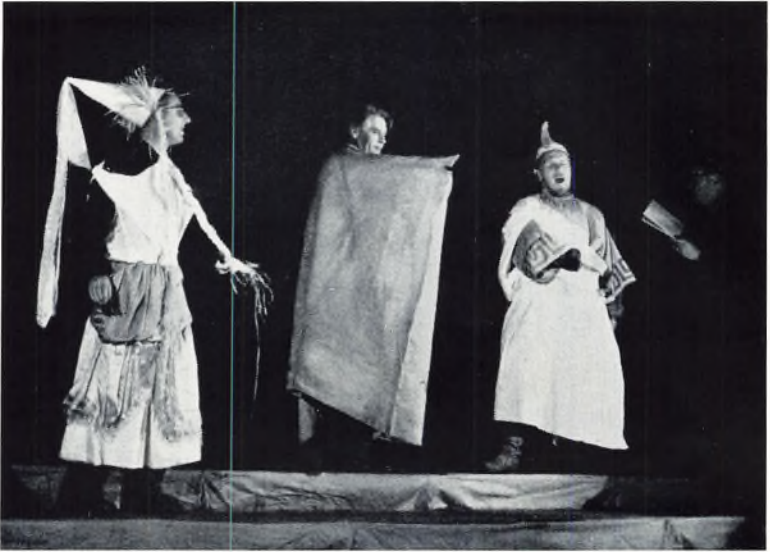
En Skærsommernatsdrøm (fra elevmødet).