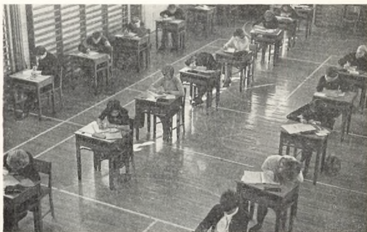
Fra den skriftlige eksamen 1965.