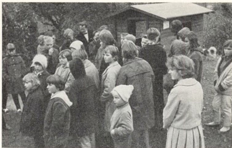
Et legehus skænkes til børnehaven i Lyksborg.