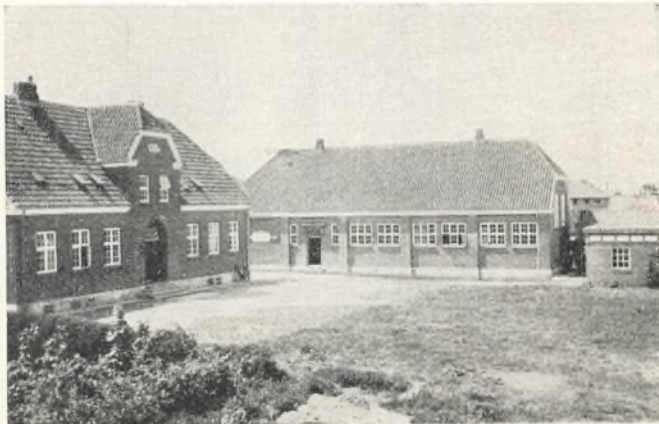
Skolen set fra gården.