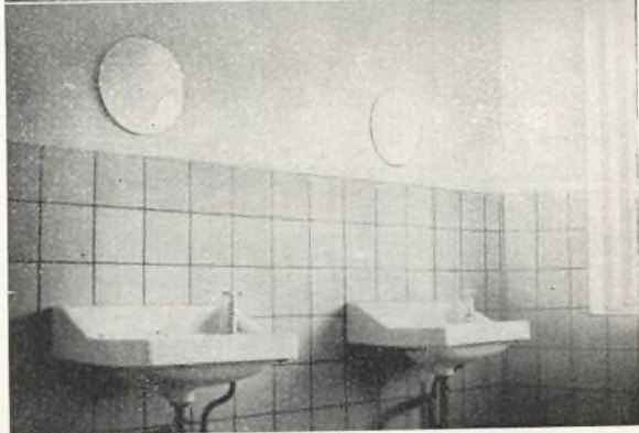
Interiørs fra skolen 1 og 2: Forhallen 3: Vaskerum på elevbygningen