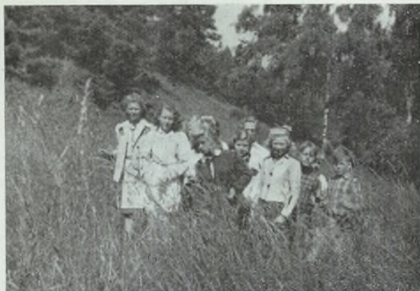
III M. Ferieudflugt. I Svanninge Bakker.

Forældre, der faar Børn optaget i Eksamensmellemskolen, maa gøre sig klart, at Eleverne først ved at gennemgaa alle 4 Mellemskoleklasser faar en afrundet Undervisning.