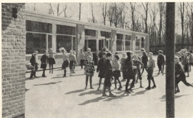
— Her er fred og ingen fare —