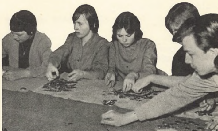
Komiteen for flygtningehjælpen arbejder.

Til Jysk Skolescene anmeldtes 317 deltagere; for et kontingent på 7,50 kr. pr. elev blev der givet følgende forestillinger: