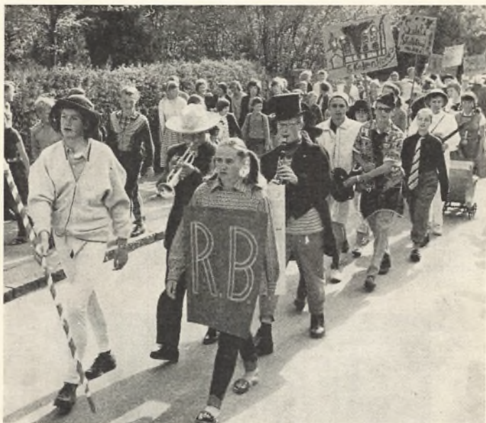
— Modig ungdom — ingen vege sjæle —

En del af årets arbejder vil blive udstillet på skolen, og udstillingen er tilgængelig under årsprøven tirsdag den 21. juni samt om aftenen tirsdag den 21. og onsdag den 22. juni kl. 19—21.