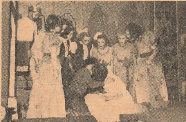
Fra årets skolefest