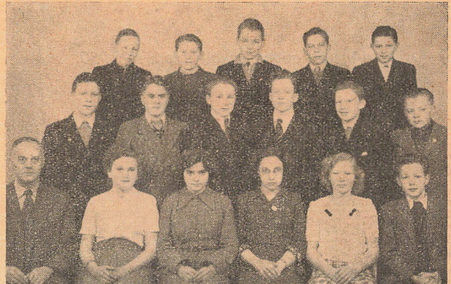
8. klasse 1949/50