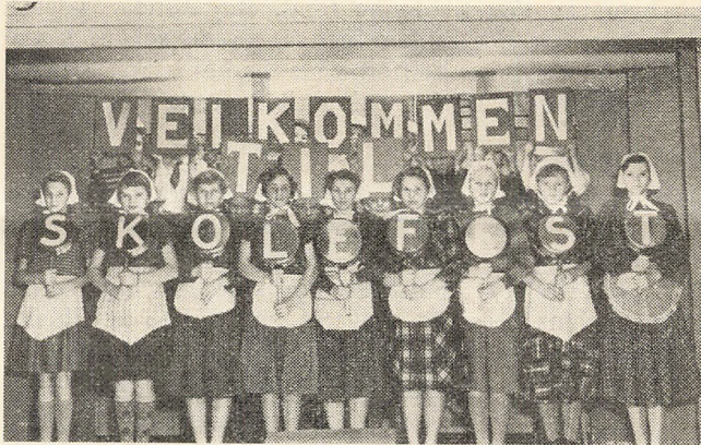
Fra årets skolefest