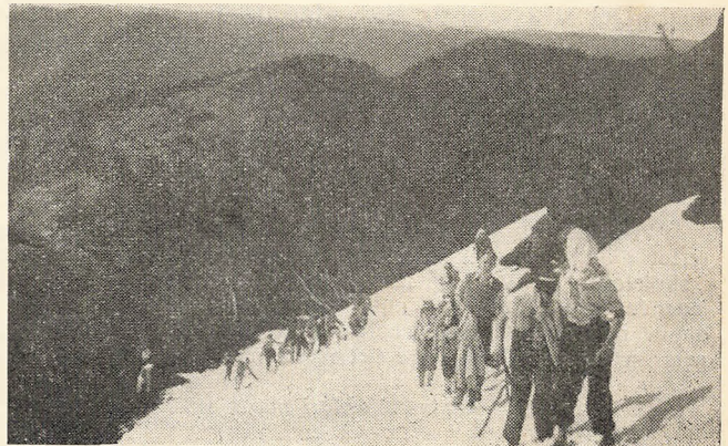
Det er elever fra IV mellem, der her viser, at de også kan klare de norske fjælde.