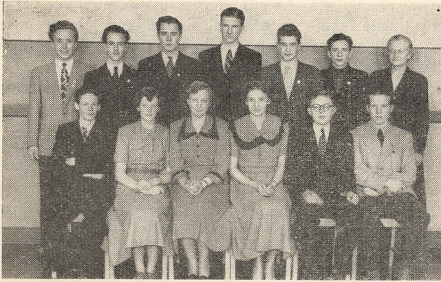
Skolens første realisthold 1951