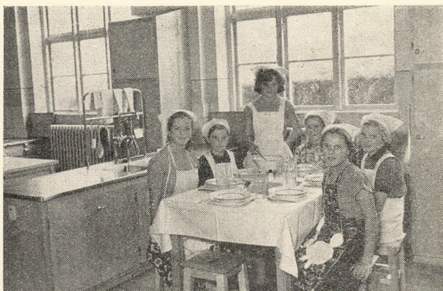
Så hyggeligt har man det i det nye skolekøkken