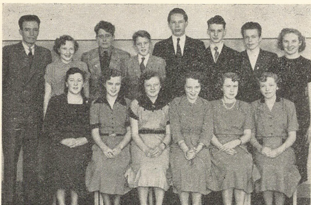
Skolens realisthold 1952