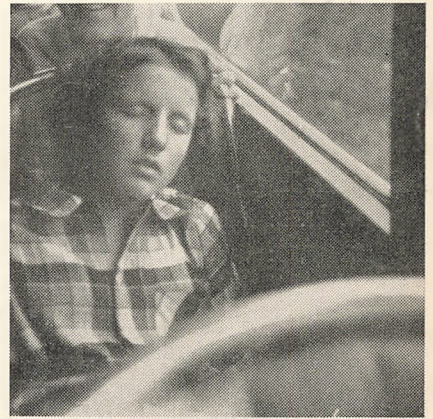
Man kan godt blive træt på en fjeldtur!