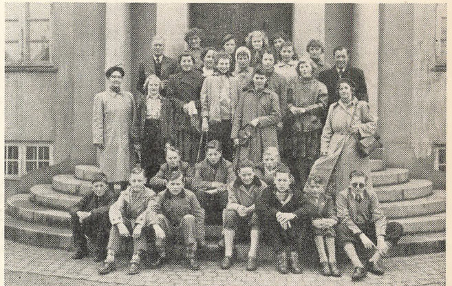
III fm's Københavnertur 1955-56