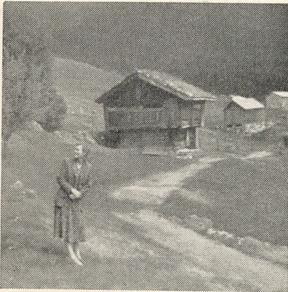
Hvor er alle mine kyllinger?