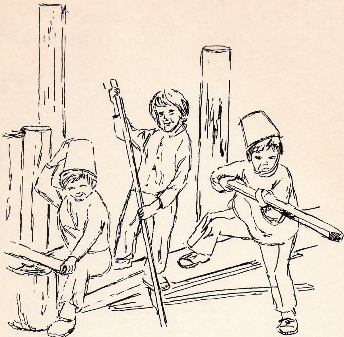
»DE TRE MUSKETERER « på småbørns legepladsen