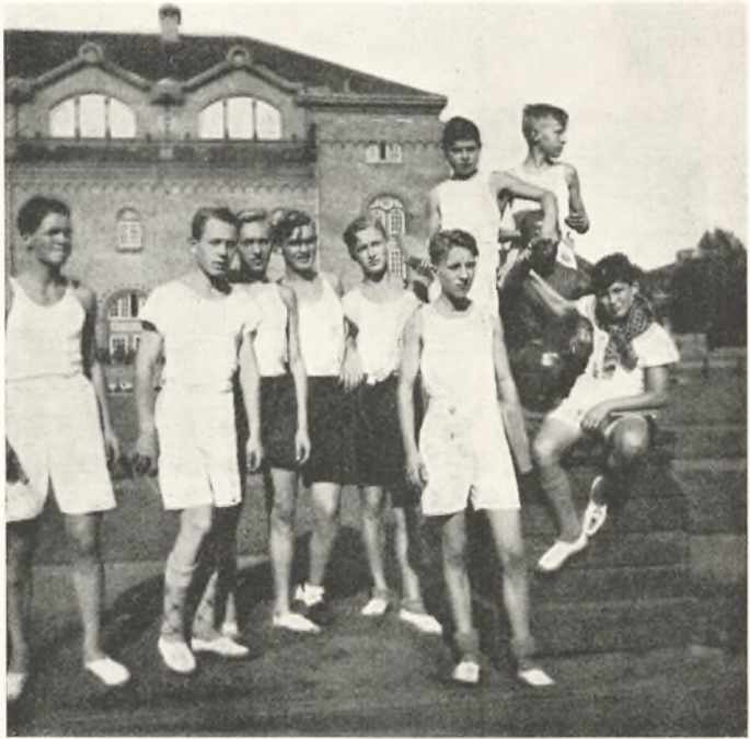
En Gruppe Deltagere ved Skoleidrætsstævnet i September 1934.

Den 9. Oktober spillede Fodboldkamp mod Lyngby Statsskole (5—4 til Ø. G.).