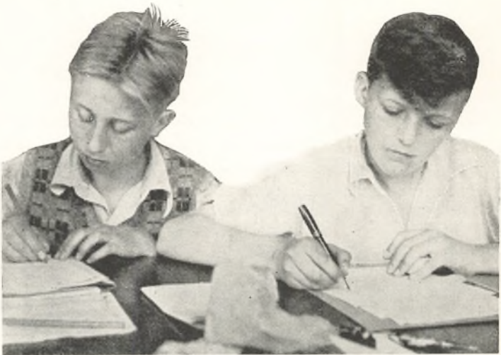
To af Lejrskolens unge „Videnskabsmænd“ opnoterer Dagens Resultater.

dagelse, og saa var man oven i Købet selv Opdageren. Her er Skitsen af Mejeriet, og her er en hel Stil om Arbejdet paa det. Her er Tegninger af Vandinsekter, og her Forklaringen. Se, her finder vi de svære botaniske Forsøg. De er gjort i Graavejr; og hvor vi sled i det med Teksten! Her er Skitsen af Lejrpladsen, opmaalt og nøje eftertegnet. Her er Skrænten ved Kignæs — dejlige Kignæs — hvor vi morede os. Her er Besvarlsen af, hvilken Sportsmand jeg synes bedst om. Og saa var Sportspladsen og Samværet om Pejsen alligevel næsten det allerbedste.