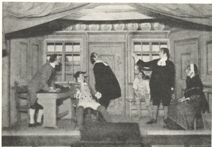
Et Scene-Billede fra Skolekomedien 1935, hvor Elever fra II G. opførte „Erasmus Montanus“.

Den 24. August deltog Elever fra Mellemskolen i Indsyngning af Grammofonplader for Columbia-Selskabet.