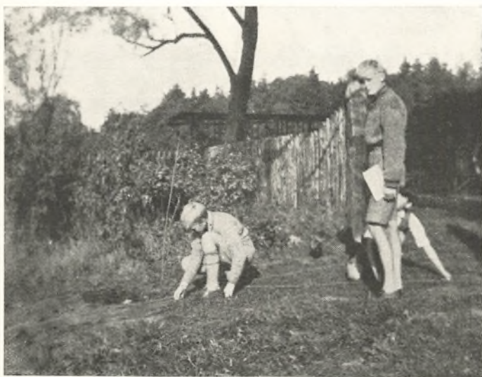
Lejrskolens Opmaalings-Arbejder giver Anledning til mange Problemer.

Ogsaa i Aar tænker vi tilbage paa Lejrskolen med Glæde. Fra den 4. til den 13. September lærte 3. M. A. Lejren ved Færgelunden at kende som Arbejdsplads . Her gik det med Humør fra tidlig Morgen til sen Aften. Det mere frie og selvstændige Arbejde er ofte som en