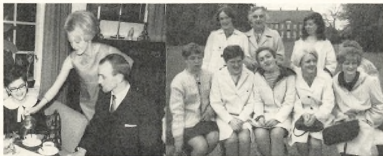
Fra fest og udflugter Januar 1968