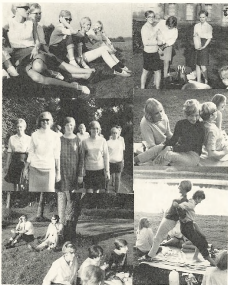
Augustholdet på Sydslesvigvej 1968