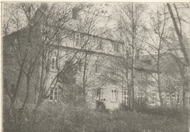
De ny Elevværelser i Haven.

imod sin Ungdoms Ideal. Vi føler, at vi staar over for en Mand, der har prøvet Livets Omskiftelser mere end de fleste, og vi føler, at han har kæmpet for sin Ungdoms Drøm, baade naar han var højest oppe, og naar han var længst nede, og altid paa en trofast og redelig Maade. Vi tænkte, ja, det maa jo være Grunden, og det er en fuldgyldig Grund. Maatte dette da blot være et Tegn paa, at de kommende Tider vil bringe Trofastheden og Redeligheden til Højbords.