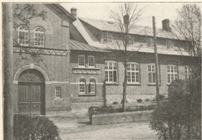
Den ny A-Skole.