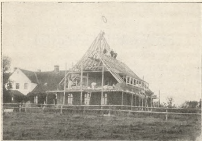
Vrigsted Højskole. — Kransen hejst paa det nye Elevhus.

ra Julestjernen og Julelysene faar Magt til at skinne ind i vore Hjerter; men det var Meningen, at et stærkt Lysvæld skulde bryde Hjertets Kulde og Sjælens Mørke.' —