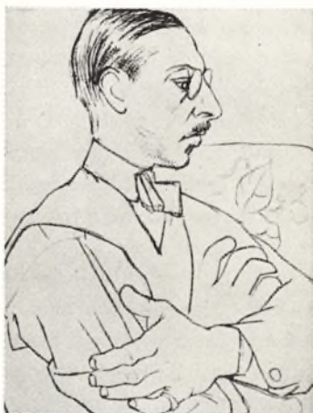
STRAVINSKIJ - tegnet af Picasso.

der voldte vanskeligheder nok til at fordre fuld opmærksomhed. Og de havde kun smil tilovers for forsøg på at begejstre dem for åndelige foreteelser, til hvilke de havde en dybt indgroet mistillid. — Og dette krav om nøgtern klarhed kom også til at præge musikken hos den yngste generation. Men i virkeligheden var grundtendensen oprindelig af negativ art, nemlig blot antiromantisk. Først i anden række søgte man at løse spørgsmålet om, hvad man skulle sætte i stedet for den romantiske musikstil.«