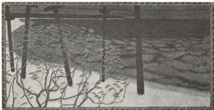
Stranden med kors.