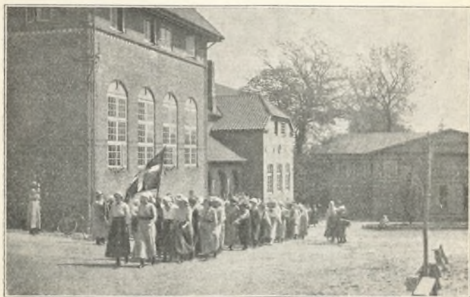
Afgang til Vejrhøj.

Sommerskolen indvarsledes med et antal tidlige indmeldelser fra Sønderjylland. De sønderjydske piger vilde i tide sikre sig plads. Deres antal løb efterhånden op til 28, så også sommerholdet blev på den måde præget af den ny tingenes tilstand. For resten var tallet på indmeldelser det største, vi nogen sinde har haft til sommerholdet, langt større end skolen på nogen måde kunde modtage. Også fra de nordiske broderlande fandt elever vej herved, 3 fra Island, 6 fra