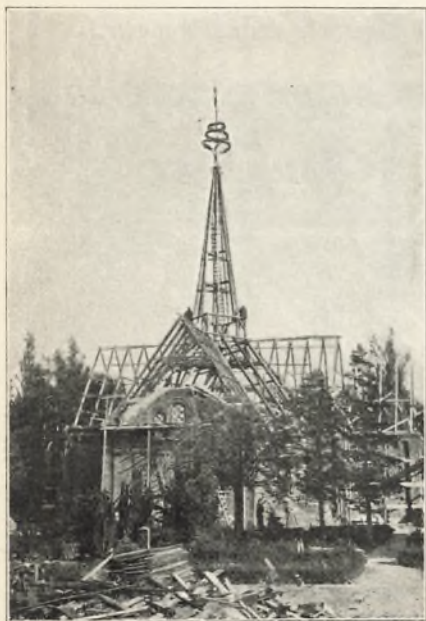
Korskirken under ombygning.

som var sat på rævnede, opløste sig og truede med at skalle af.