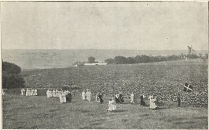
Turen til Tinghøj at hejse flag om morgenen til elevmødedagen.

Da Korskirken var under ombygning, blev det bestemt at henlægge dagens gudstjeneste til skolens øvelseshus. Den kunde da blive som første parten af festen. Hvor havde vi travlt med at få alt bragt i stand både ude og inde. Det langvarige solskinsvejr var i dagene forud endelig afløst af et højst velkomment