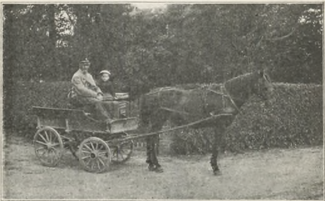
Vallekildes gamle postkører.