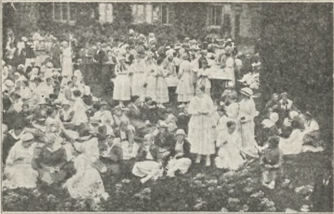
K. F. U. K.'s sommerlejr på Vallekilde højskole 1919. (Chokolade i haven).

ved vinterskolen med bopæl i den forhenværende håndværkerskole, som i den hensigt er bleven omlavet.