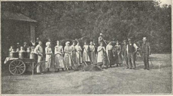
Der pudses op til elevmødet.

mødet den 3. søndag i juli. Vi vidste, at der var mange, der vilde komme til at føle savnet af den sædvanlige gudstjeneste på denne dag. Vi talte med vor præst derom, og han tilbød da at ville holde friluftsgudstjeneste i skolens have, om vejret den dag vilde tillade det.