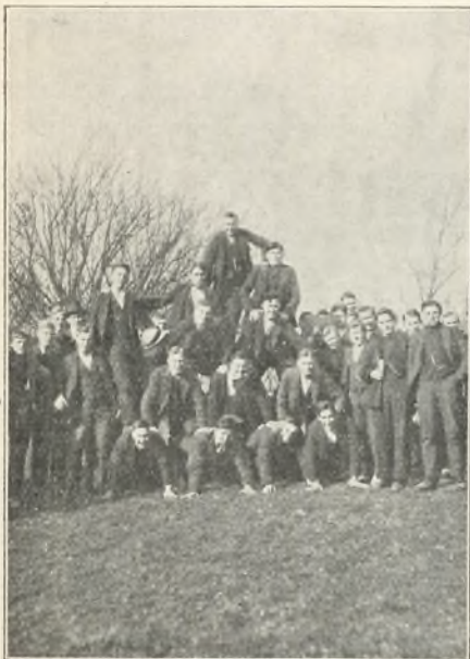
Mod slutningen på skoletiden.

Ellers prægedes vinterholdet stærkt af de mange Sønderjyder, 25 i tal. Nogle af dem havde tidligere overskredet den danske grænse og allerede i nogen tid