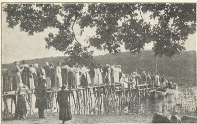
På bådebroen ved Skarritsø.

Men allerede den næste dag — St. Hansdag — stod vi atter overfor det usædvanlige: Bladene bragte bud om Tysklands indvilligelse i at underskrive den så længe ventede fred. En sådan begivenhed kunde ikke gå uænset hen. Flaget måtte til tops, mens pigeflokken stod i samlet kreds om flagstangen i haven og sang af fulde bryst. Ja, der har været meget at være glad over og taknemmelig for i denne sommer.