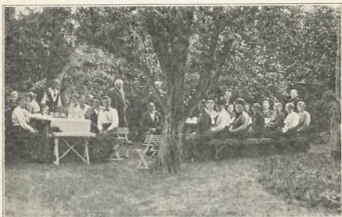
Rejsende husmandskoner på besøg.

Kort efter havde vi atter fest, om end af noget anden art. Det forbud, der under krigen var frem-