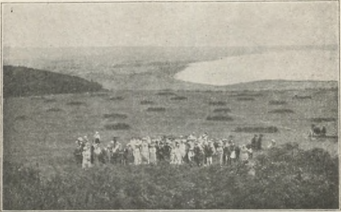
„Otte dage på højskole“ på Vejrhøj. (Udflugt).