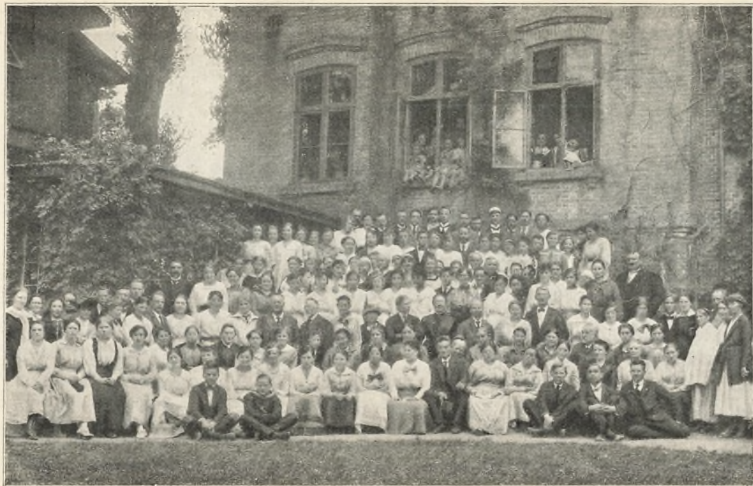
„Otte dage på højskole“ 1919.