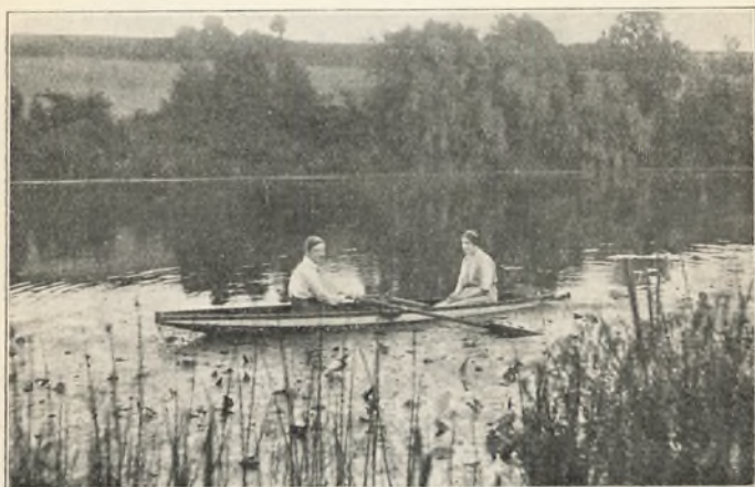
Mellem åkander på „Søen“ ved Vallekilde højskole.