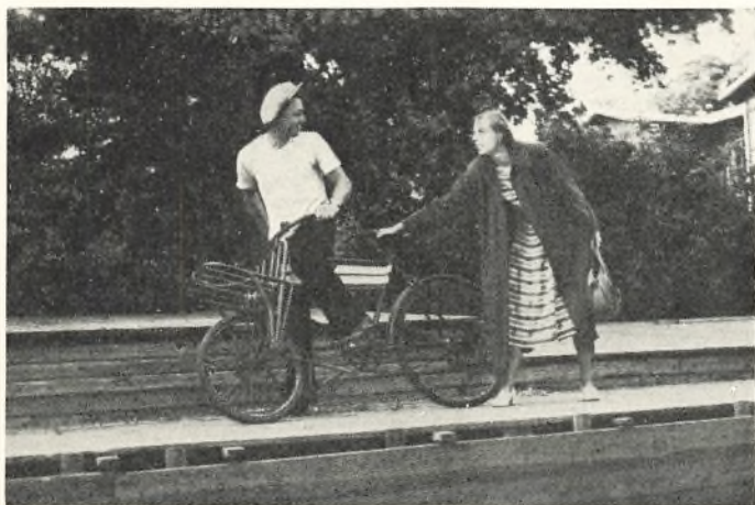
„Melodien, der blev væk“

og en meget stor forsamling fulgte opmærksomt, hvad vi bød på, fra først til sidst. Dagen derpå var forældredag, og vi havde den glæde, at mange forældre havde fulgt vor indbydelse. Dagen bød i det væsentlige på elevmødedagens program.