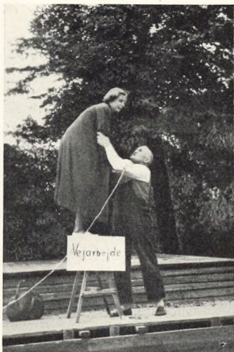
„Melodien, der blev væk“

hvor alle forud er bundet af fælles oplevelser: trods to timers vedvarende regn sad den store flok trofast og fulgte med stor medhu dem, der stred deroppe på scenen. Der blev spillet med liv og humør, selv om håret hang i våde tjavser og tøjet klaskede sølle omkring de tapre mennesker, som sled for at finde melodien igen. Jeg synes, det blev en sejr for skuespillerne og tilskuerne. — Sent på aftenen stiltede regnen af, og vi kunne slutte som vanligt ude på flisepladsen.