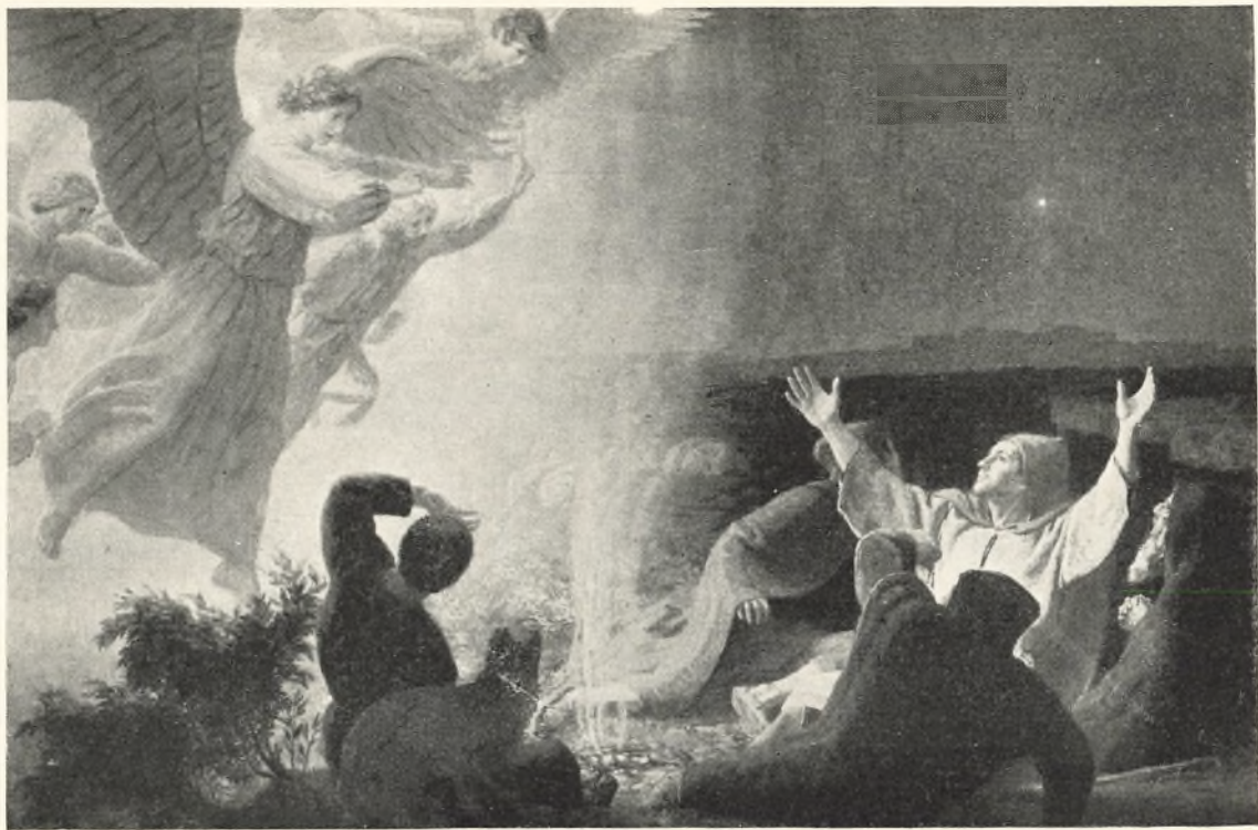
Niels Skovgård: Flyderne