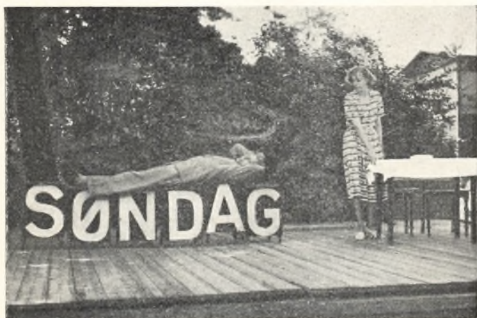
„Melodien, der blev væk“