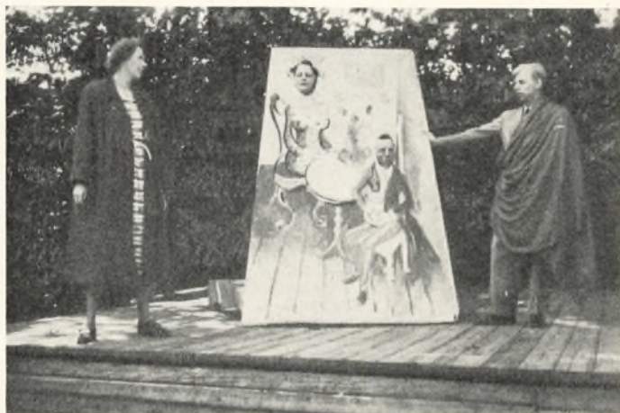
„Melodien, der blev væk“

nem en frisk og oprørsk melodi, bryder han med kontorverdenen for at spørge melodien til råds.