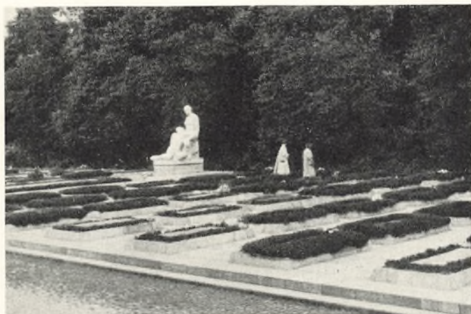
Mindelunden i Ryvangen