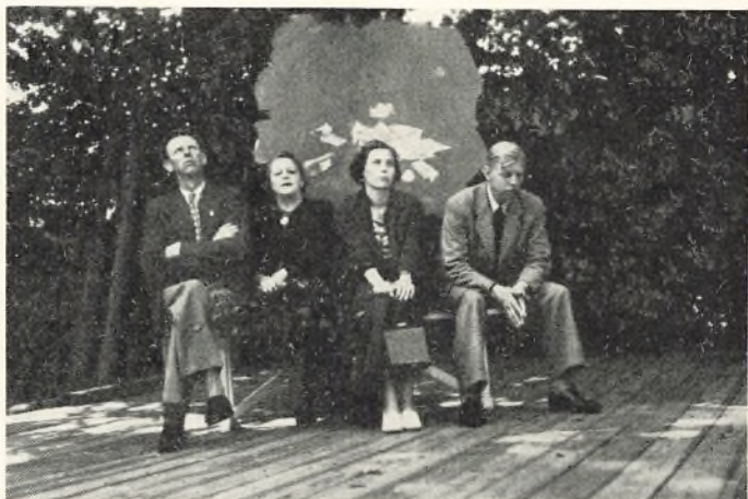
„Melodien, der blev væk“

altsammen forenet i den umiddelbare åbenhed og livstro, som barnet i så rigt mål ejer, og som vi voksne må finde på vor måde. »Det ku' bli' så godt, når alle Larsener vågner op«.