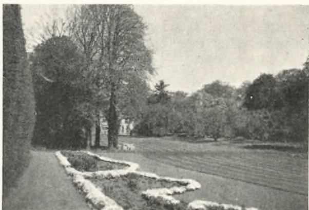
Langs den høje hæk

— Ja, men det kan vi ikke gøre noget ved. Der vil altid være en stor flok, som ikke oplever højskolen som den er, når den er bedst. Man må være glad, om man oplever det næstbedste. Åh, jeg husker min far. Når vi sad på en restauration, og han så de unge tjenere, kunne han sige: Kunne jeg bare få fat i dem en vinter. Hvor de trænger til det. Far mødtes med sin opgave alle vegne. En dag så vi på Fredensobrg station den unge prins Christian. Han spadserede frem og tilbage på perronen. Far gik også frem og tilbage, så han stadig mødtes med prinsen. Så kom far hen til mig og sagde: Åh, sikke et ænsigt, der sidder på prins Christian. Lad mig få ham på højskole. Det ville give ham så meget. Prins Christian havde et dejligt frimodigt og åbent ansigt og så netop så modtagelig ud som en ung mand fra det åbne land. Det var det, der greb far.