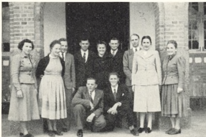
De unge tyskere

gerne med egne øjne se forholdene, dels ville vi besøge vore gamle elever, som nu tæller ca. 30 i tal. Vi rejste ikke derved for at holde foredrag eller for at træffe »spidser«; vi ville helst i største stilfærdighed besøge gamle elever i hverdagen. Det blev en rig oplevelse. Vi fik Sydslesvig langt stærkere ind i sindet end før gennem alt, hvad vi har hørt og læst. Vi blev modtaget i vore elevers hjem med en så umiddelbar godhed, at det næsten føltes som kærlighed. Vi kan aldrig glemme denne række besøg i sydslesvigske hjem. Jeg føler megen tilskyndelse til at gentage disse besøg og så måske en anden gang fortælle jer udførligt om Sydslesvig set fra de små hjems vinduer.