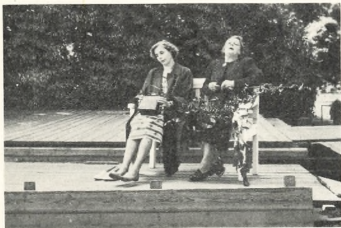
„Melodien, der blev væk“

ideer, væmmes ved livet og opsøger døden. Men døden nægter at lade sig bruge som flugt og henviser ham til at »samle melodien op«, som er alle vegne, hvor han går og træder.