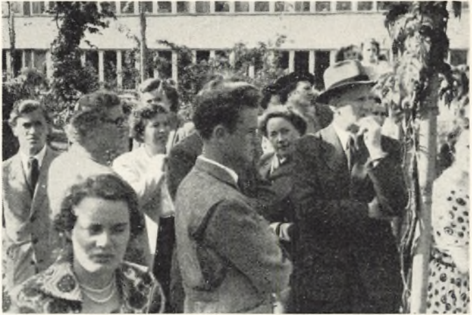
Pa Radiohusets altan