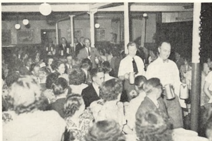
Kaffepause ved sommerballet

det har fået en så fast plads i såvel menighedens som skolens liv, at vi med glædelig forventning ser hen til dets fortsættelse.