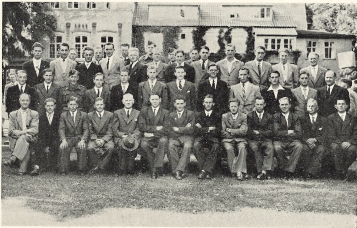
1951—52 karle til elevmøde