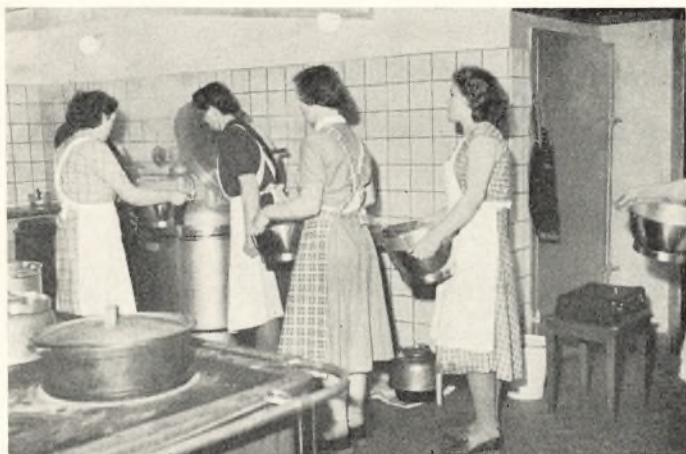
Der hentes middagsmad

november d. år; derom er der fortalt andetsteds i denne bog, og jeg henviser interesserede læsere til denne redegørelse.