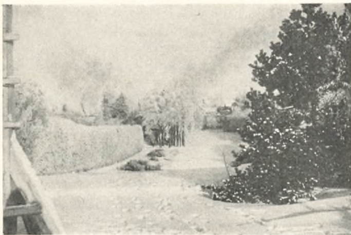
Den høje hæk

dige vidnesbyrd om menneskers yderst nøjsomme liv — (i morges kom en gammel mand med en lille skål grønt-affald til vor nabos gris; han kastede ikke det lidet bort, men gik et stykke vej, for at en smule affald kunne komme til nytte hos en anden mand, vistnok den eneste her i nabolaget, som holder et husdyr), snart imponerende indtryk af menneskers energi, snilde og dristighed. Jeg tænker f. eks. på vejene, der på sine steder er hugget som hylder ind i fjeldsiderne med den lodrette fjeldvæg til den ene side og afgrunden til den anden, eller på sluserne ved Ulefoss, Eidsfoss og Vrangfoss, hvor et ret stort skib løftes med ladning og passagerer 56 m, en mærkelig oplevelse for os, lavlandets folk!