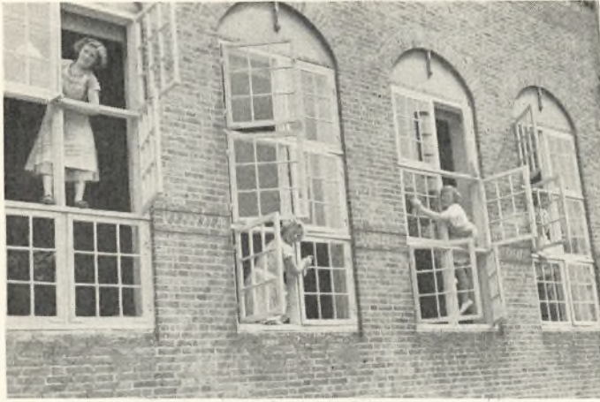
Forberedelser til elevmødet

tagere i den internationale husdyrkongres, der blev holdt i København i forbindelse med det store Bellahøjskue, kom her til Vallekilde en dag. Der lød mange tungemål den dag i Vallekilde. Det gik, som vi så tit har oplevet det før, at folk, der stopfodres med faglige og tekniske oplysninger, befriet trækker vejret, når de kommer på højskolen, og det er vanskeligt for førerne at trække dem herfra — til videre stopfodring, som de slet ikke har spor af lyst til.