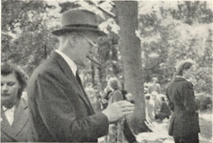
Grosen ved Skarriðso

kredsen Bjørnsons »En Fallit«. Mødet fandt så god tilslutning og fik et så godt forløb, at der er enighed om at fortsætte med et lignende møde næste vinter.