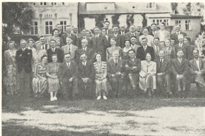
25 års jubilarer

stærke stilling som landbrugsskolerne. Men dertil kommer så den lange militære værnepligtjeneste, som betyder det mest skæbnesvangre slag, især mod højskolen. Værnepligten omfatter praktisk talt alle unge mænd; den lange tjenestetid virker sådan på mange, at de hverken før eller efter soldatertiden finder, at de har tid til et højskoleophold. Her kunne to ting hjælpe. For det første vil det være vigtigt, om højskolens venner — og det er navnlig dens gamle elever — med klogskab og varme vil tale højskolens sag og tilskynde de unge til et højskoleophold. Dernæst vil det være rimeligt, om statsmyndighederne vil ræsonnere som så: vi har gennem den lange soldatertjeneste pålagt de unge mænd en så tung byrde, at vi til gengæld før eller efter denne tjenestetid tilbyder de unge et praktisk talt frit skoleophold. Det økonomiske offer for staten hertil ville kun blive en brøkdel af 1 procent af de mægtige militære udgifter. De allerfleste skoler har i deres vände indført fællesskole om vinteren — med det resultat, at der på flere skolars vinterkursus er flere