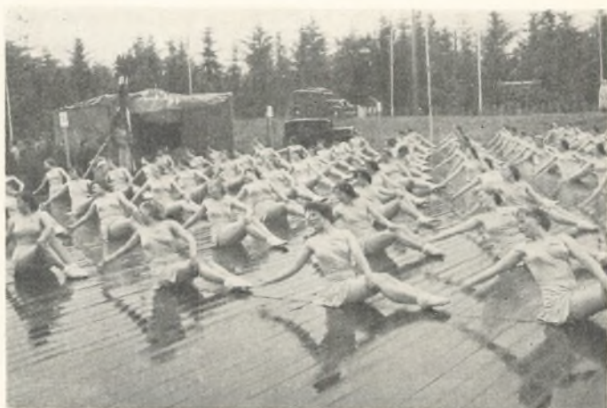
Elevholdet ved Høvefesten i øsende regn.

trinlige, oplysende film, som var udvalgt af Vald. Nielsen. Vi har jo let adgang til at leje det udmærkede tonefilmsapparat, som Vallekilde-Hørve kommunes ungdomsnævn råder over.