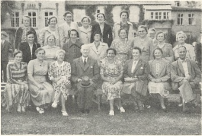
25 års jubilarer

tal, nemlig 17,3^{0/00} , fødtes 62.780, mens til sammenligning 1946 kendte til en fødselspromille af 23,4 med 96.111 børnefødsler. Vi vil nogle år føle de lave fødselstal fra begyndelsen af 1930'erne, men efterhånden skulle jo de børnerige år, der allerede nu føles som et meget stærkt pres på børneskolen, også vise sig i øget tilgang til ungdomsskolerne. Andre forhold virker dog imod os. Alvorligst rammer os her landdistrikternes og landbrugserhvervets affolkning. Da vi helt overvejende har haft vor tilslutning fra landet og landbrugets udøvere, må dette forhold ramme os hårdt, især da den almindelige højskole i hvert fald ikke hidtil har formået at drage unge fra andre sociale folkelag til sig i større tal. Her er det mit indtryk, at pigeskolen har kontakt med et bredere udsnit af vort folk end karleskolen. Mange døtre af lærere, uddelere, mejerister o. s. v. kommer på højskole, mens karlene hovedsagelig eller næsten udelukkende kommer fra landbrugernes kreds. Karlernes skolesøgning er også mere faglig præget. Husholdningsskolerne har ikke fået samme