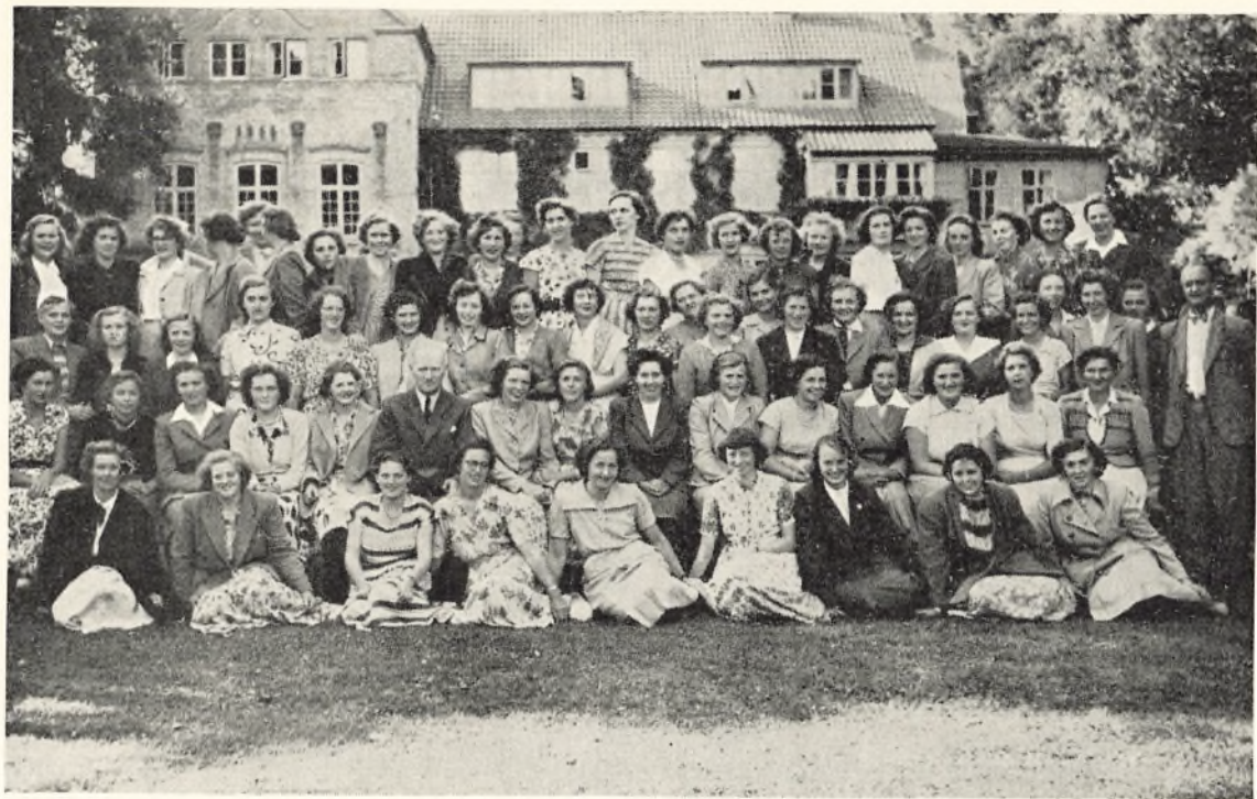
1951 piger til elevmøde