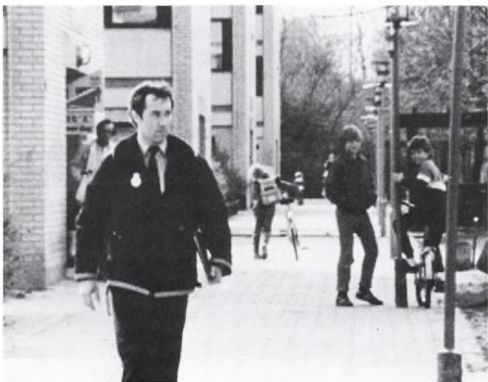
Dola Bonfils: Politiet i Virkeligheden. 1975.