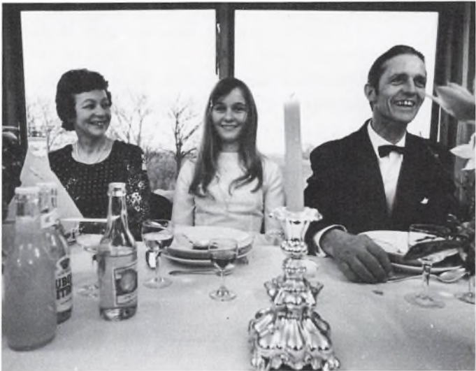
Jørgen Vestergaard: Den store Dag. 1975.