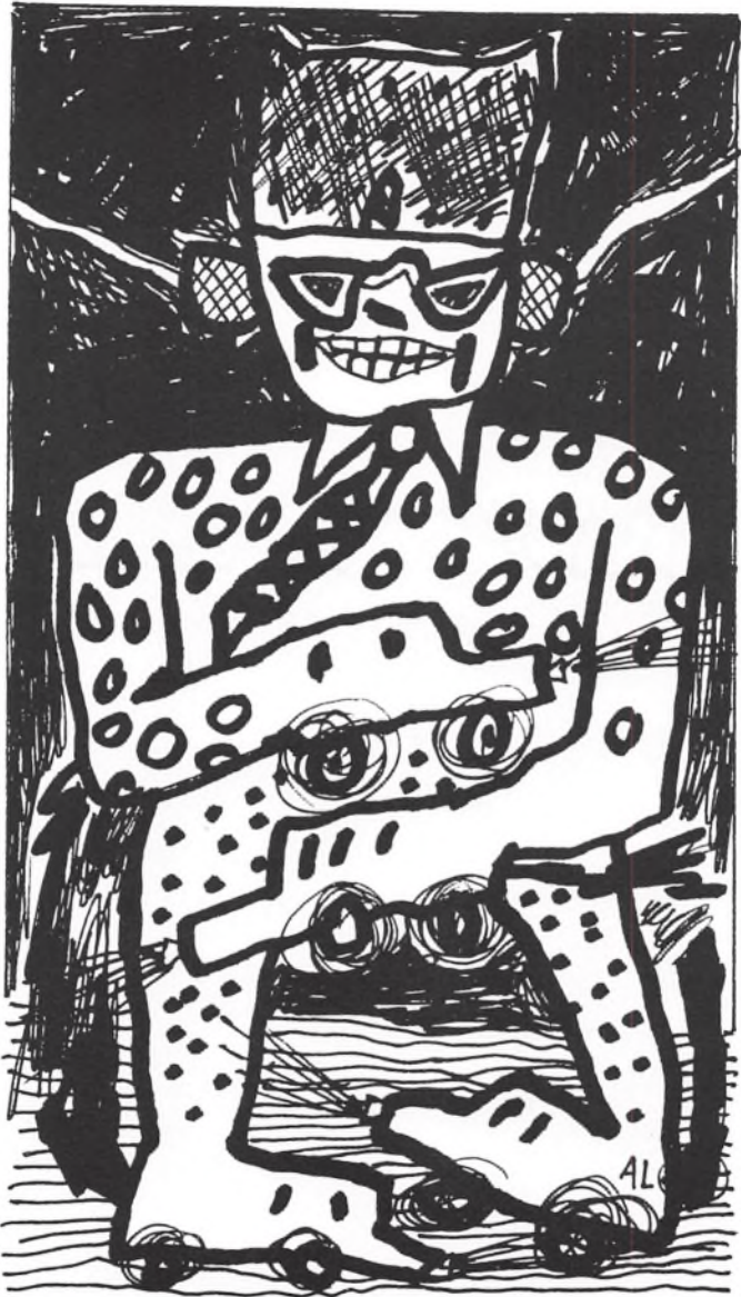
»Hr. og fru bil«