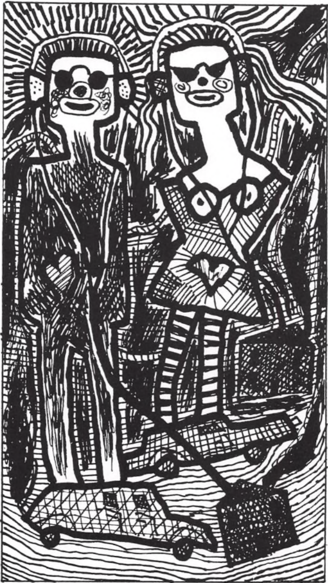
»Hr. og fru bils børn«