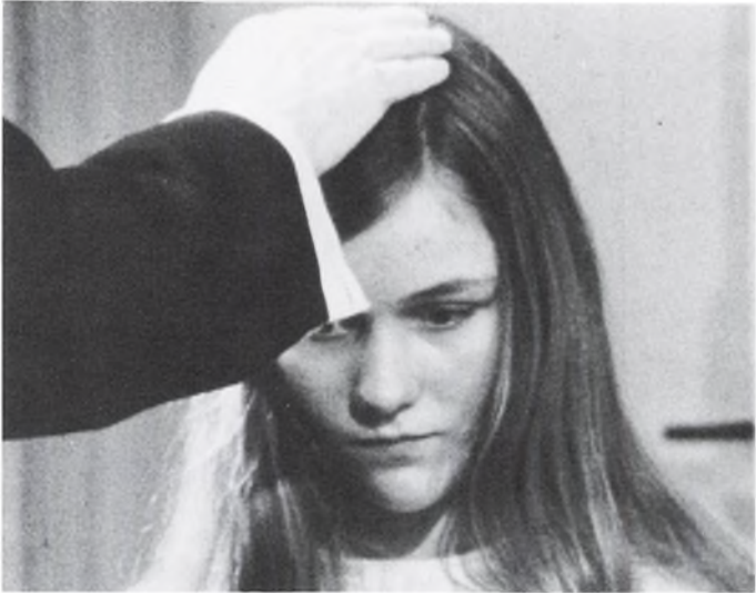
Jørgen Vestergaard: Den store Dag. 1975.