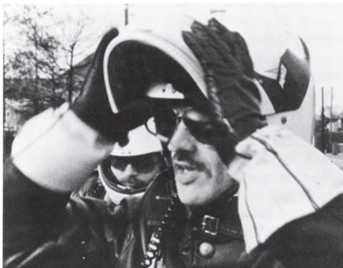
Dola Bonfils: Politiet i Virkeligheden. 1975. Foto: Statens Filmcentral.