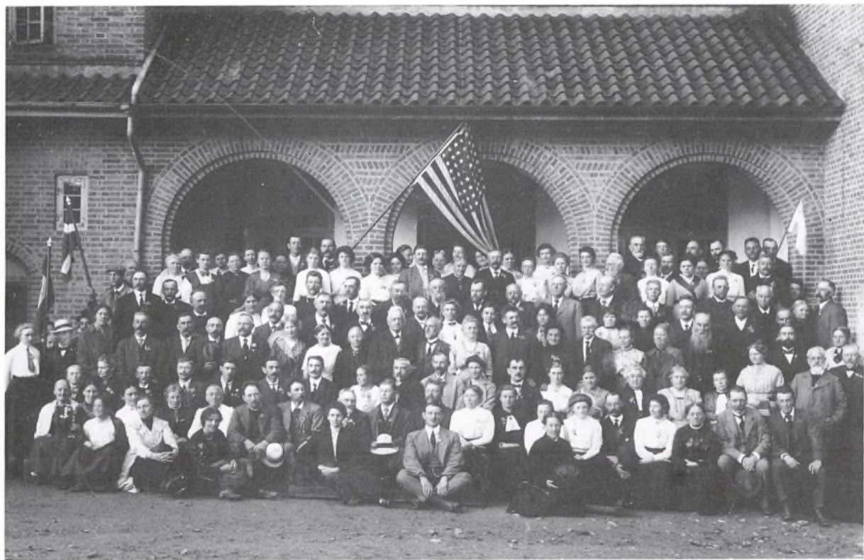
Dansk-amerikansk stævne fra 7. - 12. august 1913.