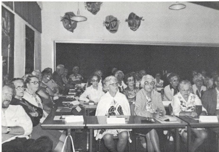
Temakursus for ældre: Kulturliv i Vestjylland 11/6 – 23/6 1980.

den alt for korte debat om USA's stationering af Pershing-raketter og Cruiser missiler i Europa startede, også her hos os. Nato's ministerråd skulle den 12. dec. tage stilling til spørgsmålet, og vi forsøgte at få fat i mest muligt materiale om spørgsmålet. I oktober udsendte Forsvarets Oplysnings- og Velfærdstjeneste en lille bog med titlen »Lighed på strategiske atomvåben«, og heri fandt vi sagen belyst fra een side. Der havde ikke været megen debat, men vi fandt dog en del artikler bl.a. fra dagspressen om spørgsmålet. Nu var der jo ikke tale om en almindelig vedligeholdelse, men om en udskiftning af