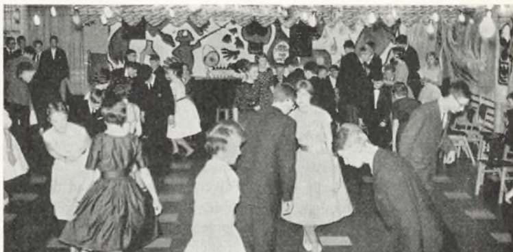
Der danses lanciers ved ballet den 25. februar.