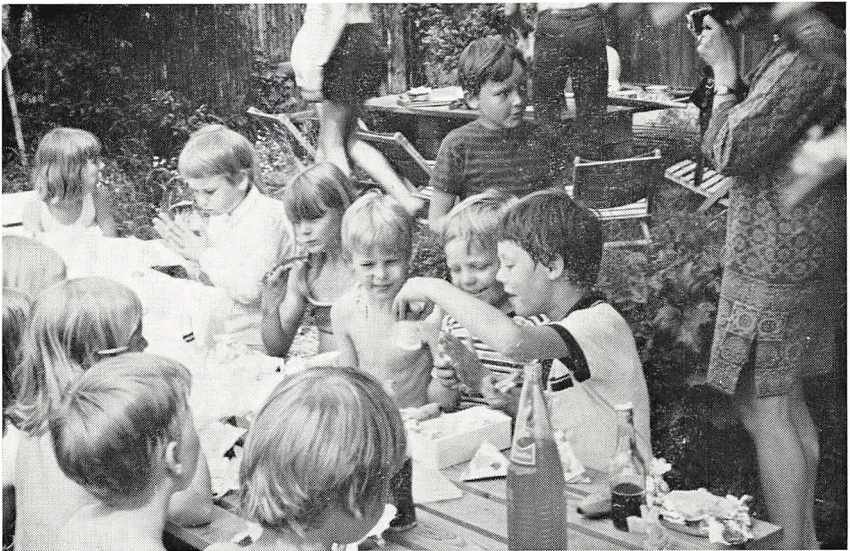
2 h holder frokost i Bennebo (juni 1971).

Klassekvotienten er normalt maksimum 24.