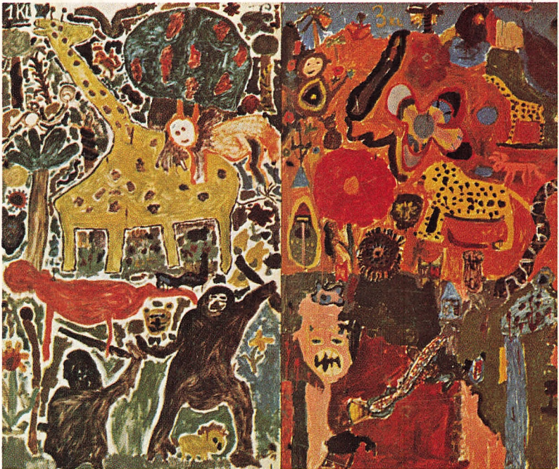
Omslaget reproducerer dele af en »urskovsfrise« i skolegården. Den udførtes af skolens yngste elever i forbindelse med skolens 75 års fødselsdag 1968