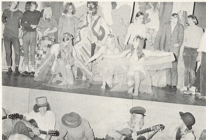
Billederne på denne side stammer fra introduktionsdagene for de nye 1g-klasser august 1972. Et vigtigt element heri var det arbejde, som udførtes i 3 musiske grupper (musik, formning og drama), og som resulterede i et lille velkomstspil for de nye elever i 1. hovedskoleklasse på deres første skoledag.