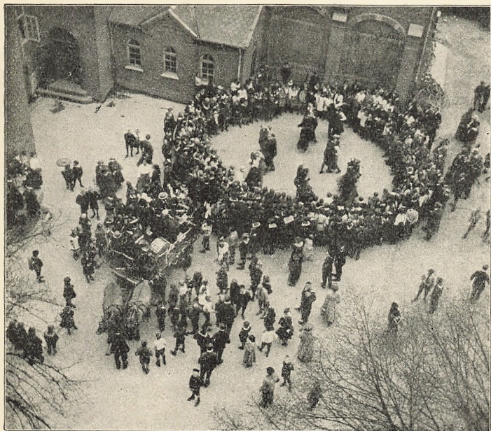
Børnehjælpsdagens forløb paa skolen, set fra skolens tag.