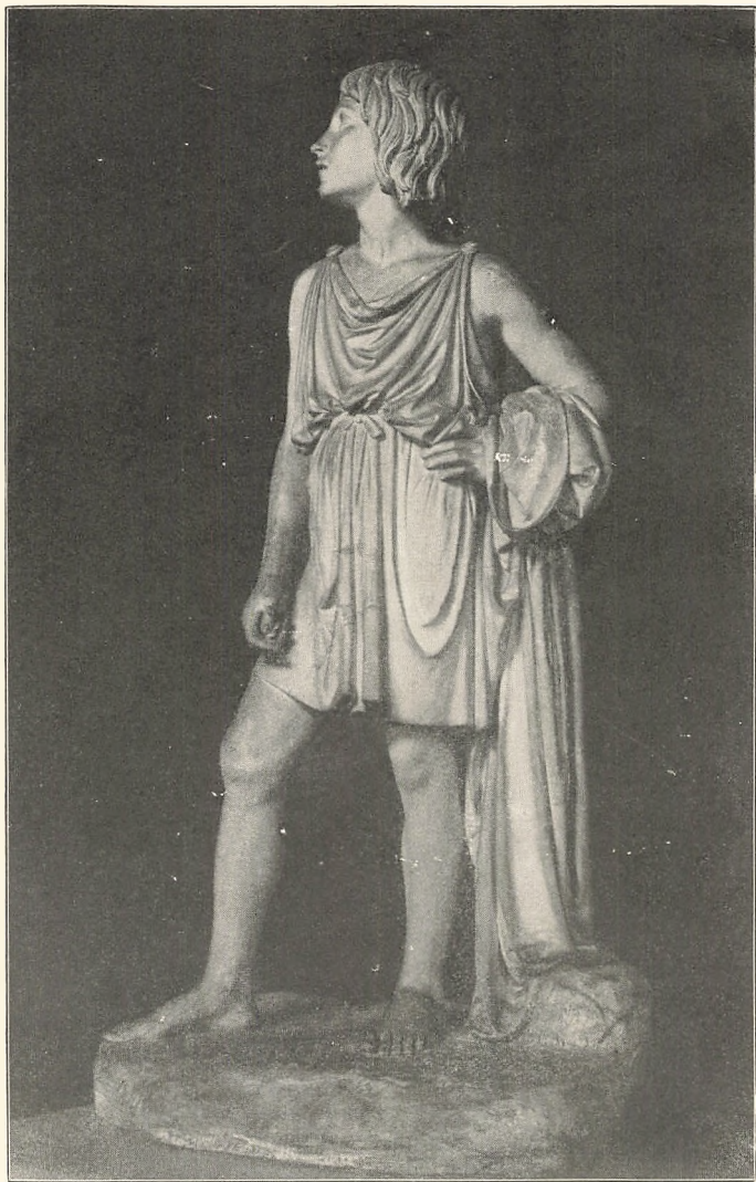
Den lyttende Yngling fra Thorvaldsens Johannes-Gruppe. Skænket Ordrup Gymnasium af en Kreds af Forældre til Skolens 40 Aars Fødselsdag d. 3—11—1913.