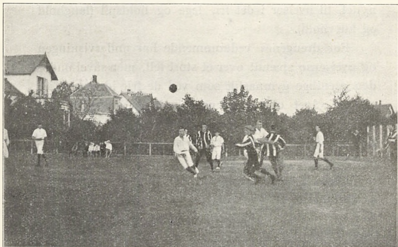
Fra skolens mindre idrætsplads (håndboldkamp med Helsingør h. almenskole).

Skolens større idrætsplads er indrettet til at kunne sættes under vand, således at vi i frostvejr kan have en fortrinlig bane til skøjteløbning. Desværre har