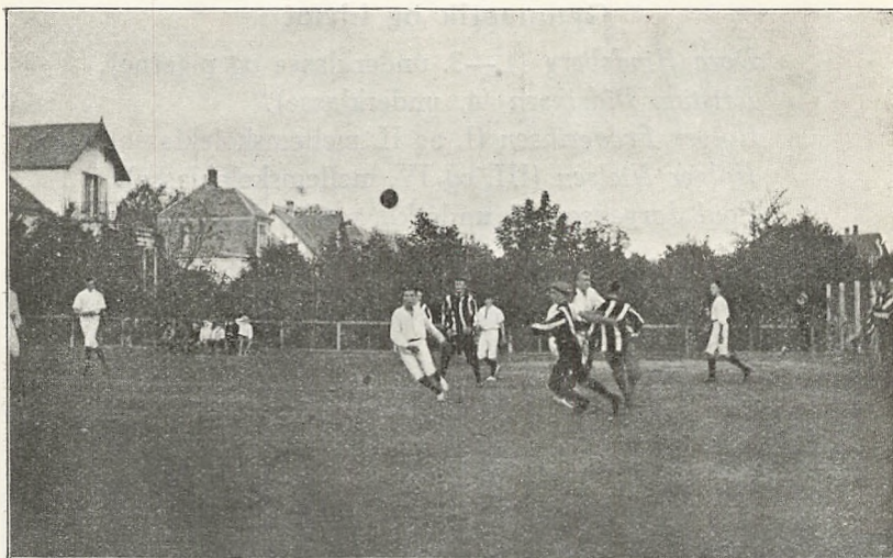
Fra skolens mindre idrætsplads (håndboldkamp med Helsingør h. almenskole.

nyttet til øvelser i det fri, lege og boldspil (langbold og kurvbold).