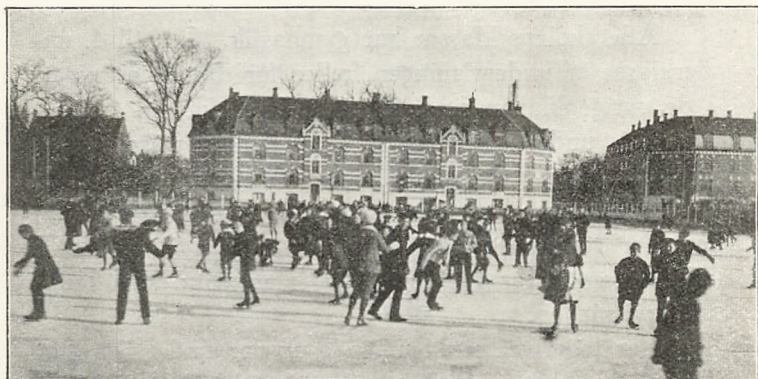
Det store frikvarter på skolens isbane.

For drengenes vedkommende har undervisningen og