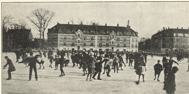
Det store frikvarter på skolens isbane.