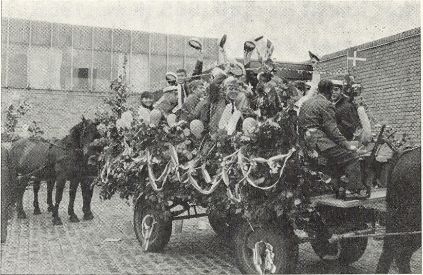
Afgang fra »Den gamle skole«