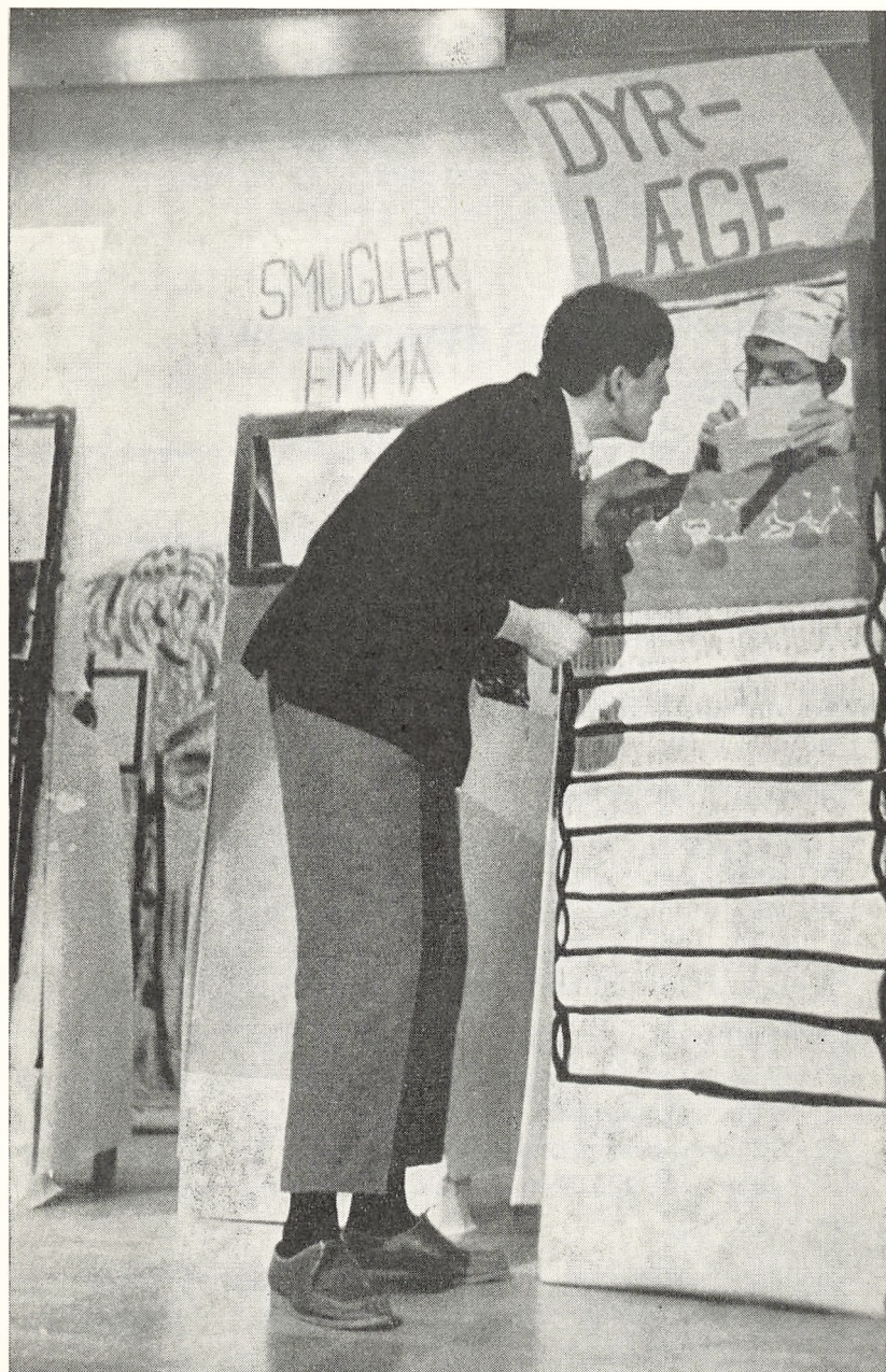
Årets skolekomedie «Hr. Puntila» af Bertold Brecht