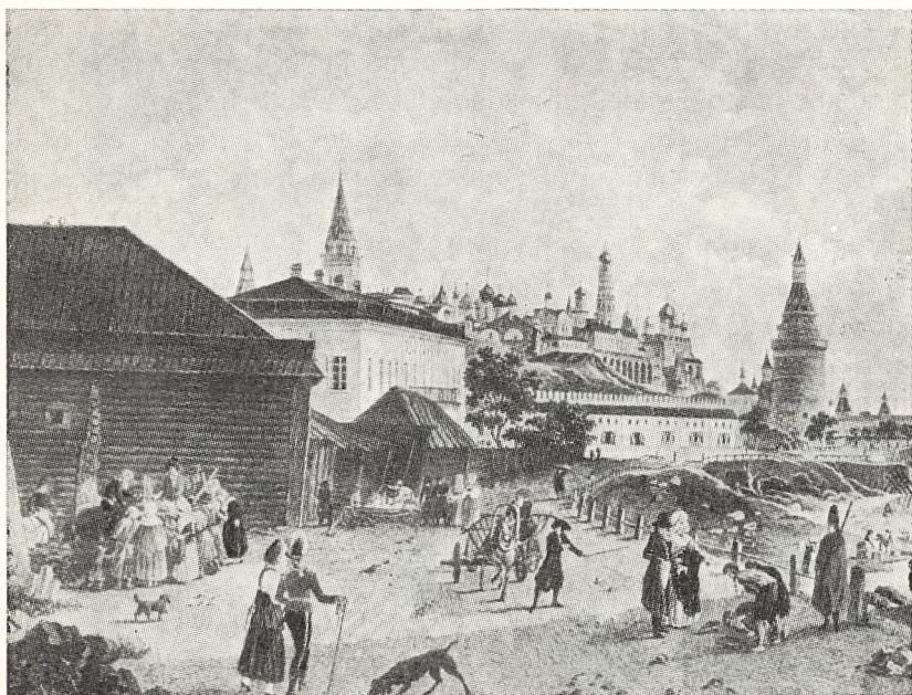
Moskva omkring 1800

For at camouflere den sidstnævnte slags kriges sande karakter har man altid ført krigene under et eller andet idealistisk røgslør. »Gud, konge og fædreland« har gang på gang måttet holde for, og rækken kan fortsættes med »the war to end all wars«, »gloire et grandeur«, »Herrenvolk und Untermenschen«, »Den frie Verden«, »Demokratiske Frihedsrettigheder« og andre luftige begreber. Mulighederne for at besmykke oprustning, krig, ødelæggelse og elendighed er næppe udtømt foreløbig.