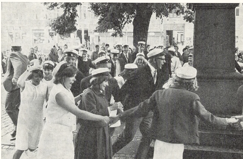
Ved Frederik den VII på Køge torv