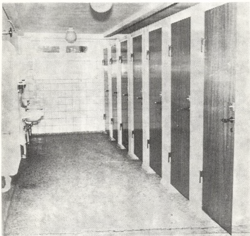
Fra den nye kælder med toiletter på Møllemarkens skole