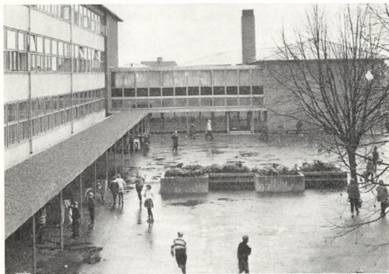
Den nye skole - set fra den gamle

Den 21. august startede man så den nye skole med et elevtal på 751, fordelt på 4 førsteklaser, 4 andenklaser, 4 tredjeklaser, 3