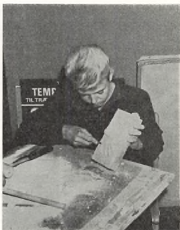
Formning - et nyt fag, der har holdt sit indtog i realafdelingen og snart kommer i gymnasieklasserne