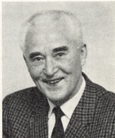
H. C. ANDERSEN * 23/3 1895

Alle forhenværende elever fra vor gymnasieskole husker de to dygtige og meget afholdte gymnasielærere, der også efter deres afsked har virket ved vor skole.