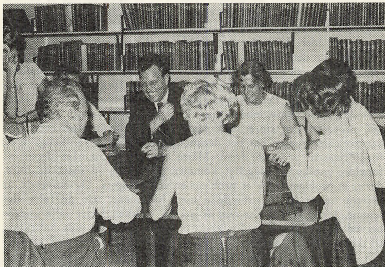
Der holdes forældremøde

Til sidst et par ord om vort skolenævn. Vi har betragtet det første år som et forsøgsår, hvor vi skulle indkøre denne nydannelse og finde en form. Jeg skal ikke bedømme resultatet endeligt på nuværende tidspunkt, men vil dog gerne på skolens vegne sige tak for godt samarbejde, og det er lærernes mening, at nævnet har virket på en måde, der er i harmoni med tanken om et skolenævns mission.