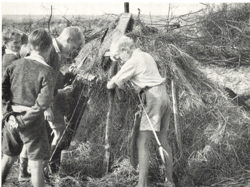
»Vi bygger selv!«