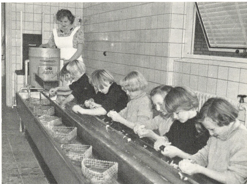
»Et nap med ved køkkenarbejdet«.