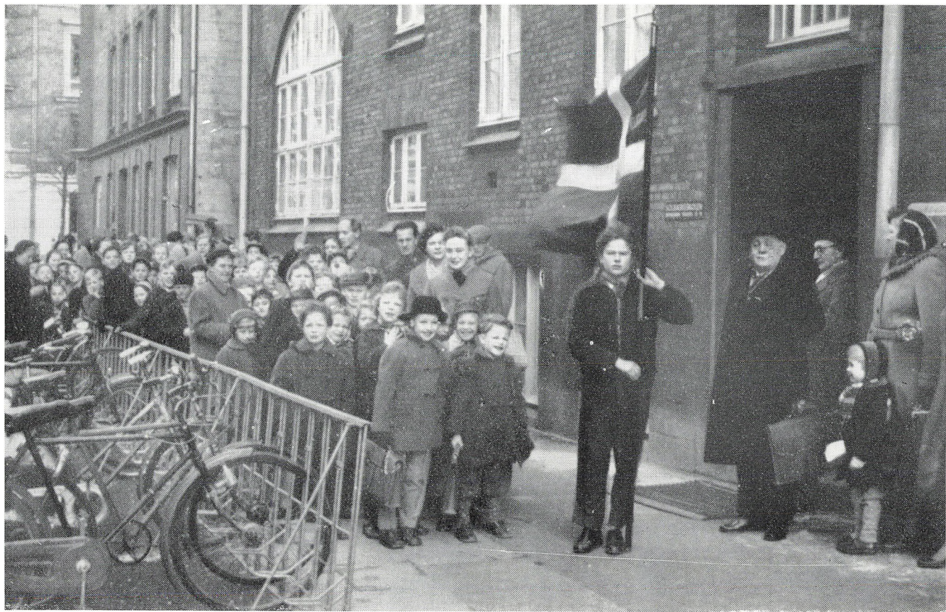
Roanenes ankomst til Solbjergskolen den 7. januar 1957.