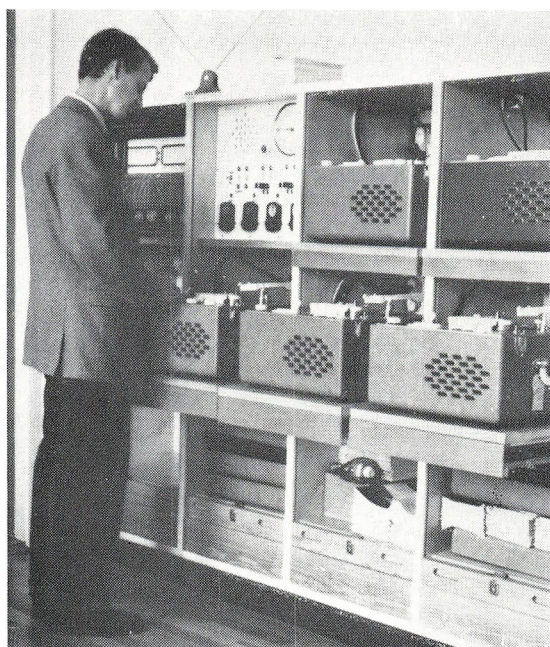
Frederiksberg Skolevejens Båndcentral, Sønderjyllandskolen.