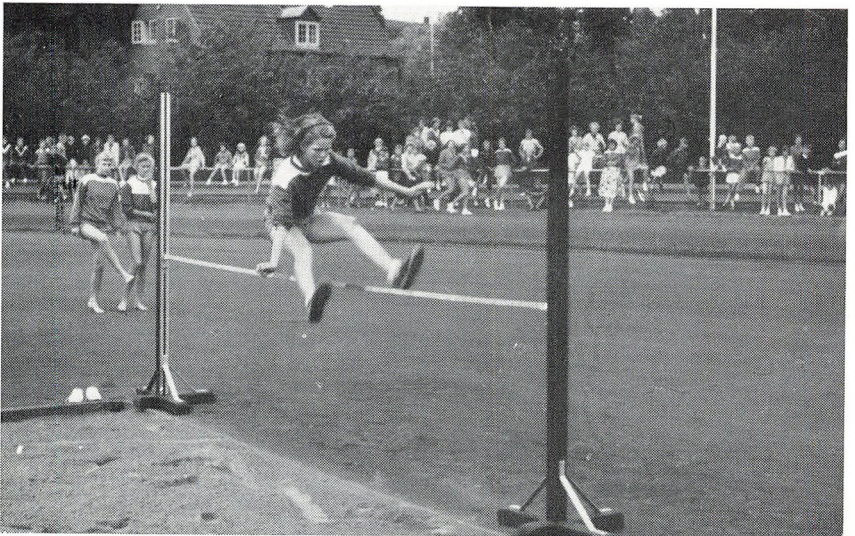
Den frederiksbørgske skoleidrætsdag 1956.