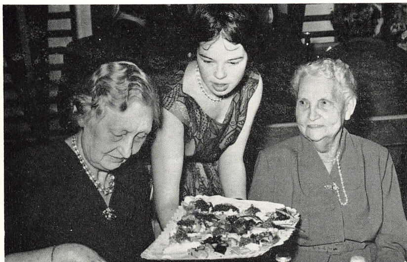
Skolens forhv. inspektør med to elever, hvoraf den ældste, 81 år gammel, var med til skolens indvielse.