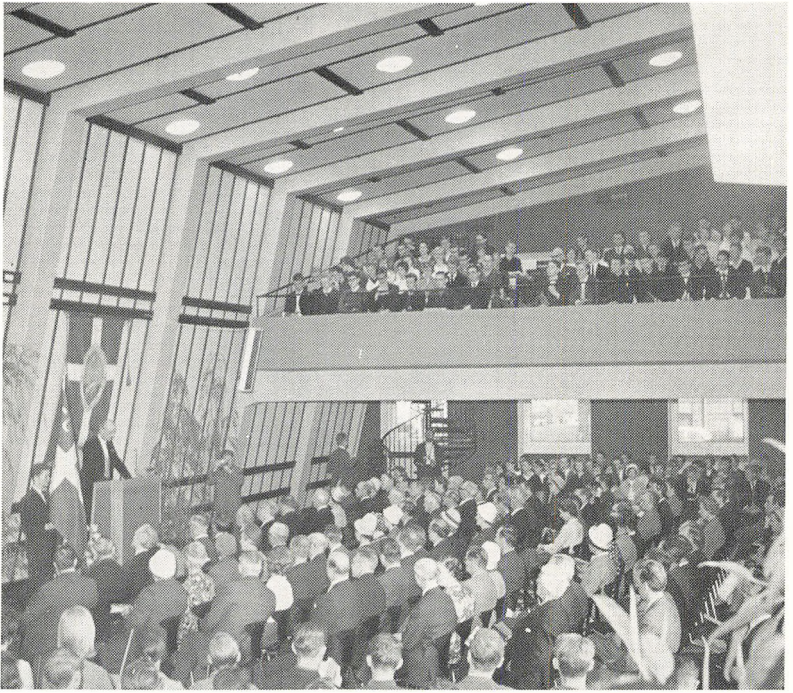
Indvielse af Frederiksberg Gymnasium (efter ombygning og udvidelse) i skolens nye aula den 1. maj 1961.