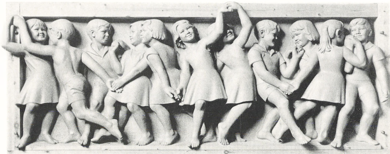
Til udsmykning af Søndermarksskolen i anledning af 25 års jubilæet skænkede forældrene med tilskud fra kommunen et relief, der blev overdraget skolen den 4. november 1960. Det var udført af billedhugger Max Andersen som et supplement til hans relieffer fra skolens indvielse 1934.