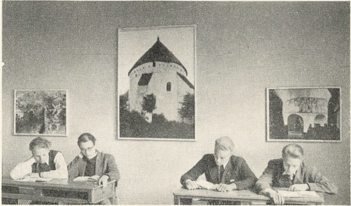
Fra Klasseværelset med Billeder af Rundkirke-Arkitektur. Foroven: Østerlars Kirke: Gang i 1. Etage, Kirken set fra Nordøst, Midterparti i nederste Etage. — Forneden: Fresko med Eva, Slungen og Adam paa Midtpillens Kapitæl i Nylars Kirke.