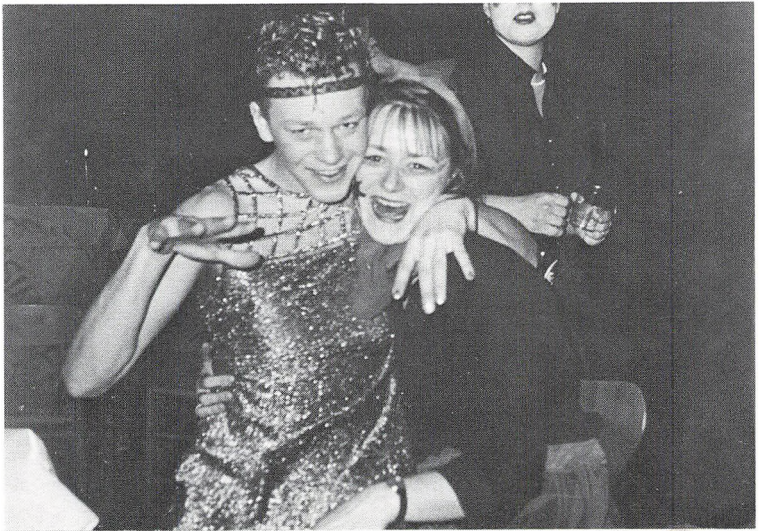
Karneval, vinteren 1987.