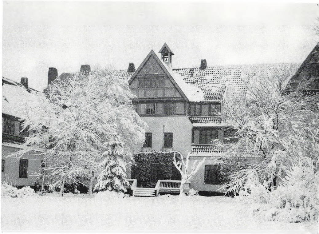
Den gamle hovedbygning i sne fra havsiden.