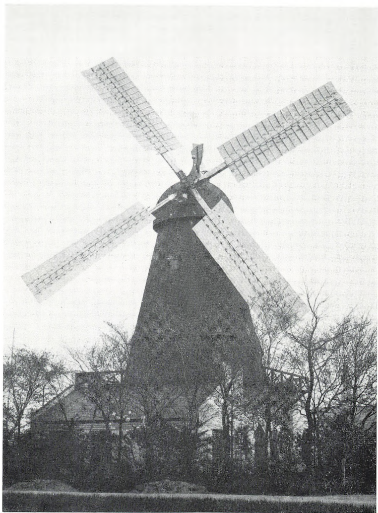
Den gamle forsøgsmølle.