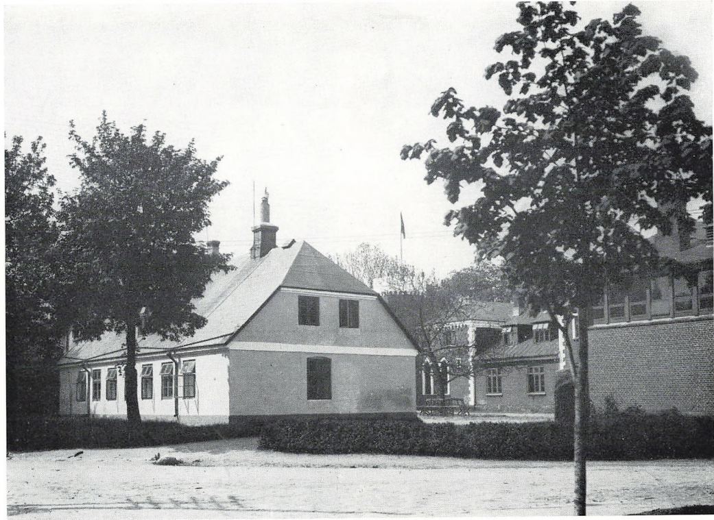
Fengers Hus (før 1913).