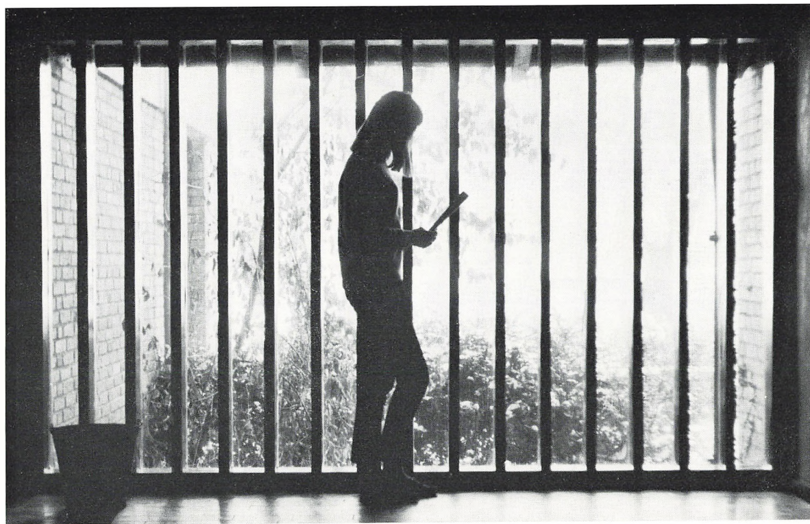
Udsigt fra mellemgangen.