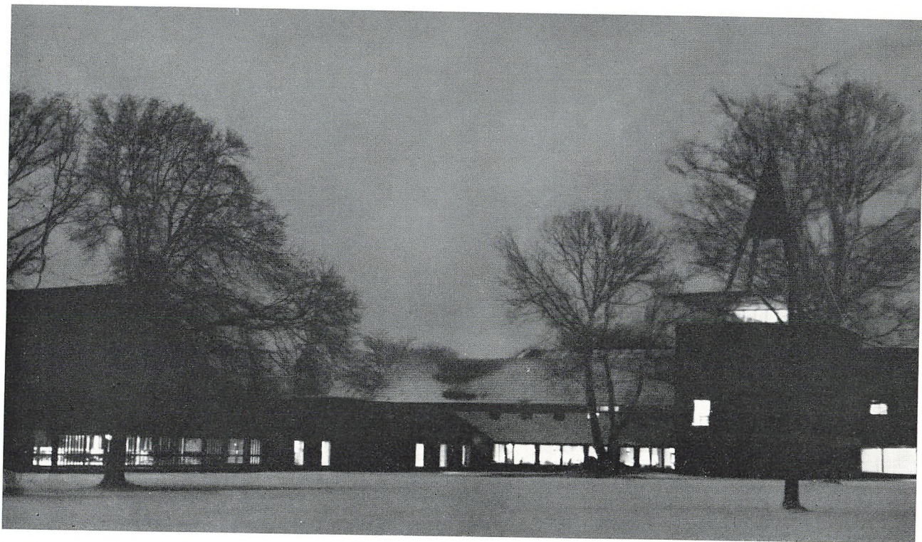
Aftenbillede af den nye skole.