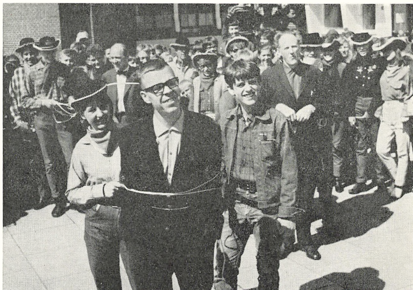
Situation fra 9. klassernes og 3. realernes sidste skoledag før eksamen

Boghandler Kjeldsen Banken for Løgstør og Omegn Løgstør Savværk Boghandler Rolighed Aggersborg Sparekasse Diskontobanken Manufakturhandler Neve