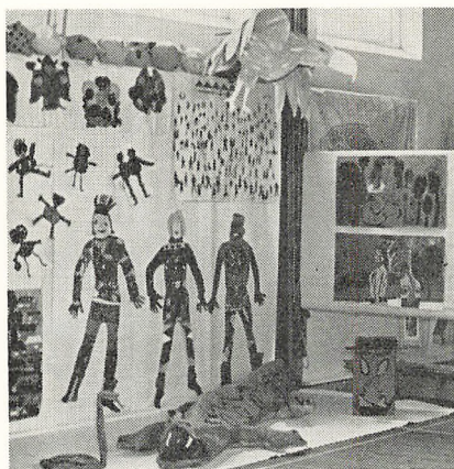
Et par kig fra udstillingen af elevarbejder.