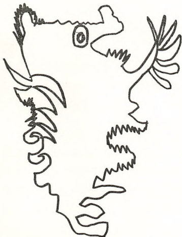
»Djævlerok« tegnet af Søren Christensen, 2.a.