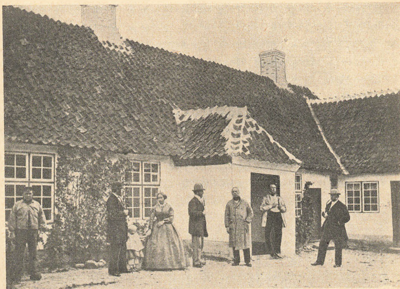
Ringsted Borgerskole indtil 1876 (hj. af Nørregade og Sct. Bendtsgade)

Før 1876 lå Ringsted Borgerskole på hjørnet af Nørregade og Sct. Bendtsgade. I 1875/76 byggedes skolen i Sct. Knudsgade. I begyndelsen var der kun klasseværelser i stueetagen, medens 1. sal var lærerboliger. Da børnetallet steg, måtte disse dog omdannes til klasseværelser. Skolen i Sct. Knudsgade var sidste gang i brug den 14. marts 1941, da den blev overtaget af besæt-