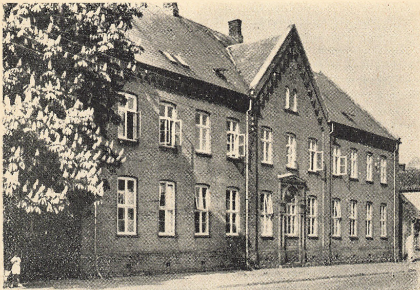
„Den gamle skole“ i Sct. Knudsgade (1876—1941)

Vil da denne vækst fortsætte? Nej, ikke i samme tempo. Følgende oversigt vil give et billede af, hvordan forholdet ligger, idet der gøres opmærksom på, at før 1939 lå fødselstallene i flere år et sted mellem 90 og 120: