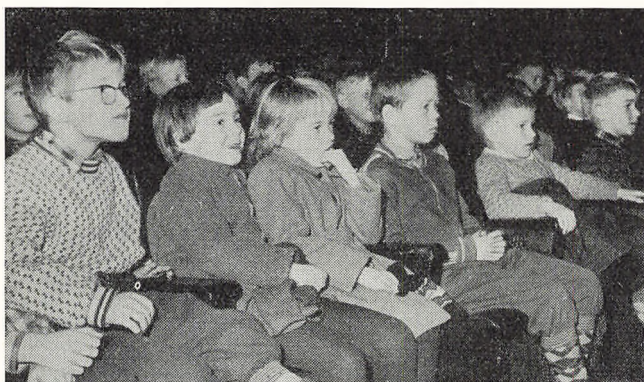
Børn som tilskuere