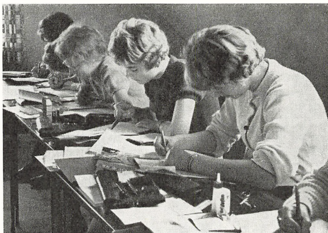
Der arbejdes på lejrskolen

I september 1960 erhvervede Ringsted kommunelærerforening Bækken skole i Rinkenæs kommune i Sønderjylland med det formål at ombygge den til lejrskole for skolebørnene i Ringsted Børgerskole.