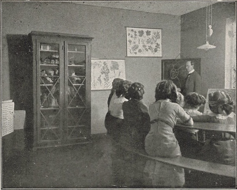
Et Hjørne af Naturhistorisk Værelse.