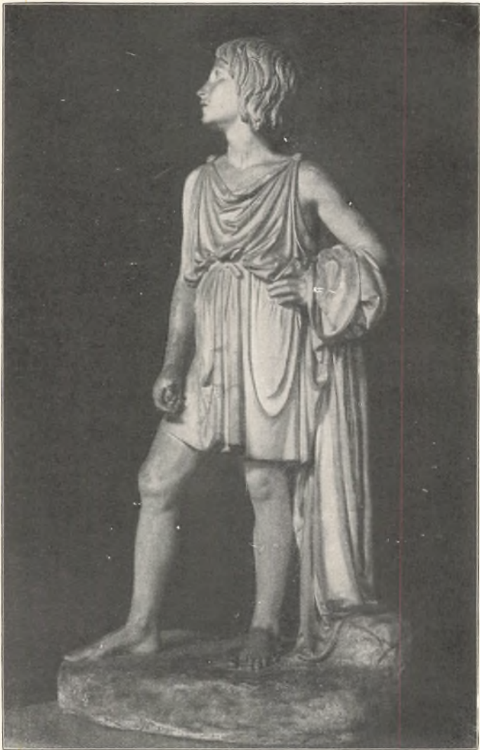
Den lyttende Yngling fra Thorvaldsens Johannes-Gruppe. Skænket Ordrup Gymnasium af en Kreds af Forældre til Skolens 40 Aars Fødselsdag d. 3—11—1913.